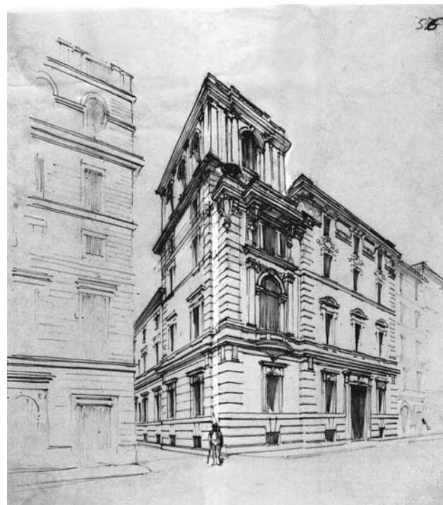
Fig. 1. G. Giovannoni, studio prospettico del palazzetto Torlonia a via Tomacelli. (Roma, Archivio del Centro di Studi per la Storia dell'Architettura).

Inoltre, sul tema dello sviluppo, crescita e trasformazione della città di Roma nel primo Novecento, in continuità con i già consolidati studi su Giovannoni della sottoscritta (volumi Qualità architettonica e qualità urbana nell'edilizia borghese e popolare a Roma 1890-1930 , Roma 2005; e La casa dei Crescenzi e l'edificio di congiunzione con il palazzo