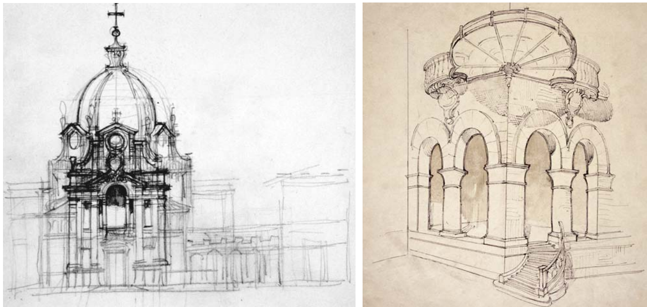
Fig. 2. G. Giovannoni, schizzo di studio per la chiesa del Sacro Cuore a Salerno (a sinistra); palazzetto Torlonia di via Tomacelli, schizzo prospettico dell'ingresso principale (a destra). (Roma, Archivio del Centro di Studi per la Storia dell'Architettura).

dell'Anagrafe: dal carteggio di Gustavo Giovannoni. In Gustavo Giovannoni riflessioni agli albori del XXI secolo , Roma 2005) si segnalano due ulteriori interventi: la partecipazione al convegno dal titolo Centenario Roma Marittima Cento Anni di Architettura (Ostia Antica, 27 novembre 2015), e un contributo dedicato alla vicenda novecentesca della Casa dei Crescenzi, sede del Centro Studi per la Storia dell'Architettura, istituzione fondata da Giovannoni fin dal 1939, con particolare riferimento alle trasformazioni dell'area urbana circostante (dicembre 2015).