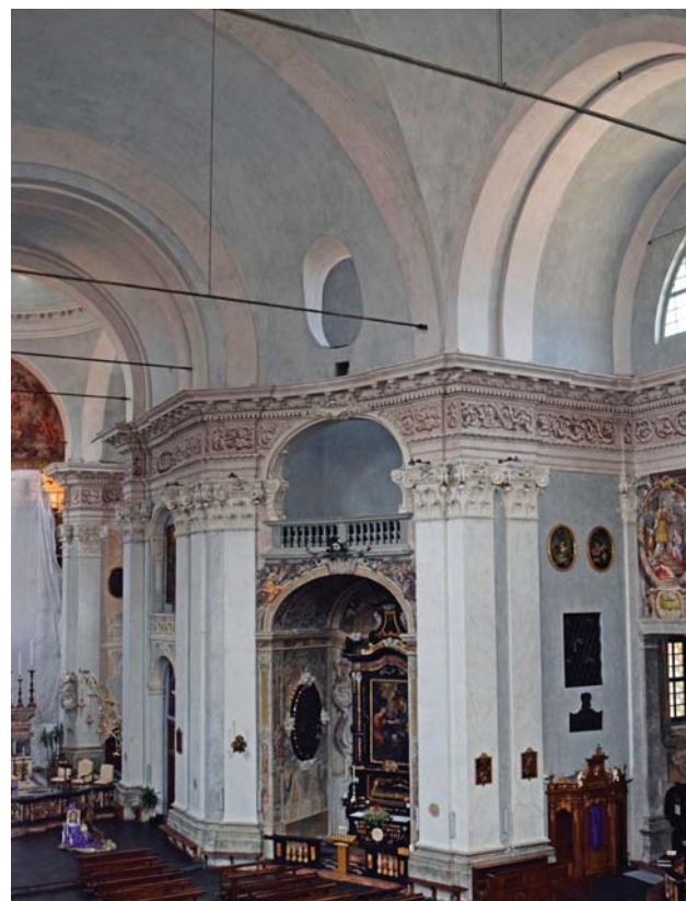
Fig.1. Chiesa di San Giovanni Battista a Morbegno, veduta dell'angolo del corpo centrale.