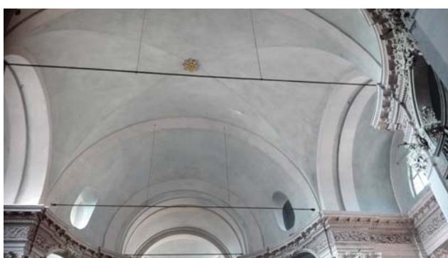
Fig. 3. Chiesa di San Giovanni Battista a Morbegno, veduta dell'interno.

L'indagine, intesa a chiarire le fasi di stratificazione decorativa, ha indotto ad approfondire l'argomento relazionando i dati conoscitivi ai principi del restauro, che guidano e orientano le scelte progettuali, le quali, per quanto riguarda gli interventi già attuati e da attuarsi oscillano tra finalità essenzialmente "conservative" e azioni di riproposizione dell'assetto seicentesco.