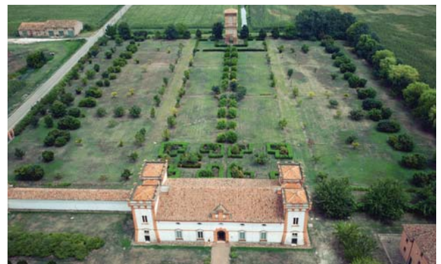
Fig. 1. Immagine acquisita da drone relativa alla villa e al giardino rinascimentale retrostante.

Partendo dalla descrizione del progetto di rilevamento dell'area, improntato ad una acquisizione multi-scala e multi strumentale, si è avviata una fase di analisi fondata sulla osservazione del manufatto, l'acquisizione e l'archiviazione di un sistema ordinato di informazioni iconografiche legate al territorio, al giardino, alle pertinenze e al palazzo esterno ed interno, consentendo di costruire alcune prime rappresentazioni e mappe tematiche di analisi architettonica e territoriale fondata sulla sola osservazione dell'esistente. L'acquisizione digitale del territorio, della architettura e di alcuni suoi dettagli è avvenuta attraverso la fusione di differenti metodiche di rilevamento dirette ed indirette, atte ad integrare, validare e in certi casi confutare i dati rilevati con una singola metodologia. Partendo quindi dal progetto di rilievo geometrico e materico del territorio e della architettura interna ed esterna, finalizzato alla conoscenza del bene e la sua restituzione grafica in scala 1:100, sono state descritte le diverse fasi di raccolta dei dati fino alla messa a sistema