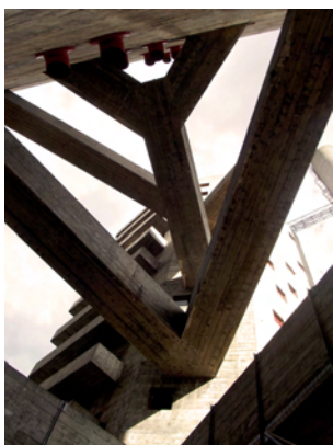
Fig. 5 – SESC Pompéia, le passerelle di collegamento tra le torri.

svelare la destinazione d'uso. Il loro rigore formale non le pone in contrasto con la struttura originaria della fabbrica, mentre pochi ma significativi elementi – le bucatore e le passerelle di collegamento (Fig. 5) – ne lasciano intuire la funzione non produttiva.