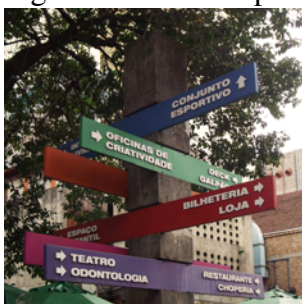
Fig. 4 – SESC Pompéia.

Nel progetto del SESC è evidente come alla cultura italiana della Bo Bardi si affianca l'esperienza brasiliana, con particolare riferimento agli anni trascorsi a Salvador; questi hanno probabilmente contribuito a ispirare le linee per l'organizzazione interna degli spazi esistenti e per la realizzazione ex novo . Tali dettami si concretizzano nel porre al centro, ancora una volta, le attività dell'uomo.