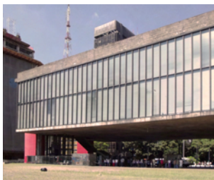
Fig. 1 – Museu de Arte de São Paulo (MASP), São Paulo, 1969.

Libertà, allora, da concetto astratto diviene materia, architettura; il senso di autonomia suscitato dal vão livre (Fig. 2), dai settanta metri di luce libera, in continuità spaziale con l'Avenida Paulista, si sposta negli spazi espositivi del MASP: «Non cercai la bellezza, cercai la libertà» (14).