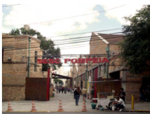
Fig. 3 – SESC Pompéia, São Paulo, 1986.

Nell'entrare al SESC Pompéia (Figg. 3, 4) si ha immediatamente la sensazione di essere altrove, poiché esso nulla ha a che vedere con la gran parte della città, caotica e disumana, ma allo stesso tempo ci si rende immediatamente conto che tutto lì, dalla strada interna alle alte torri, riesce a rappresentare, meglio di tanti altri luoghi paulistani, lo spirito della sua comunità, il suo desiderio di stare insieme.