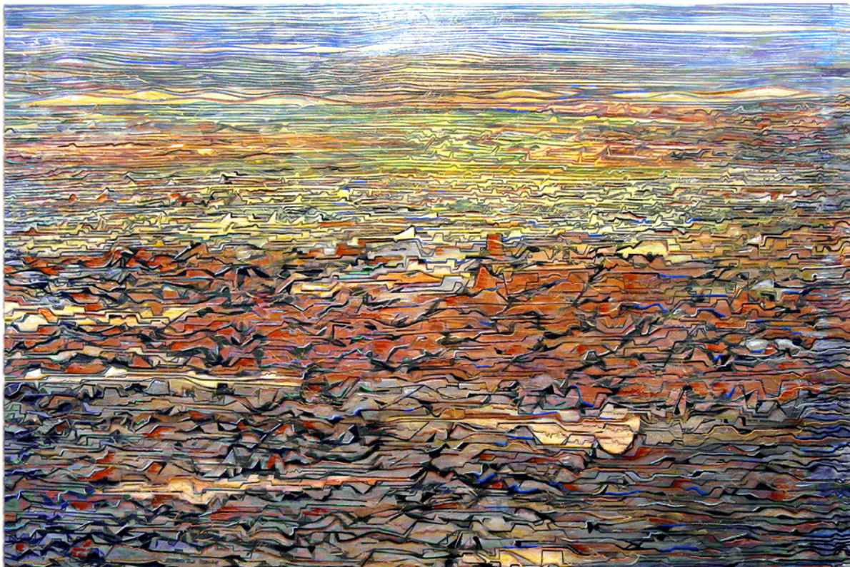
Ruggero Lenci Metamorfosi e Antilopi