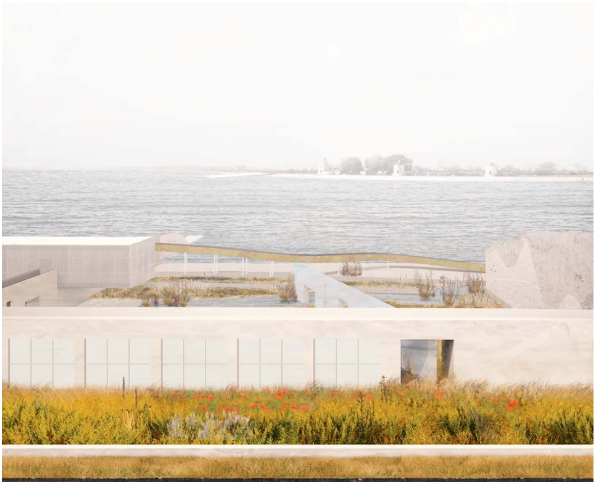
The wall and the nature