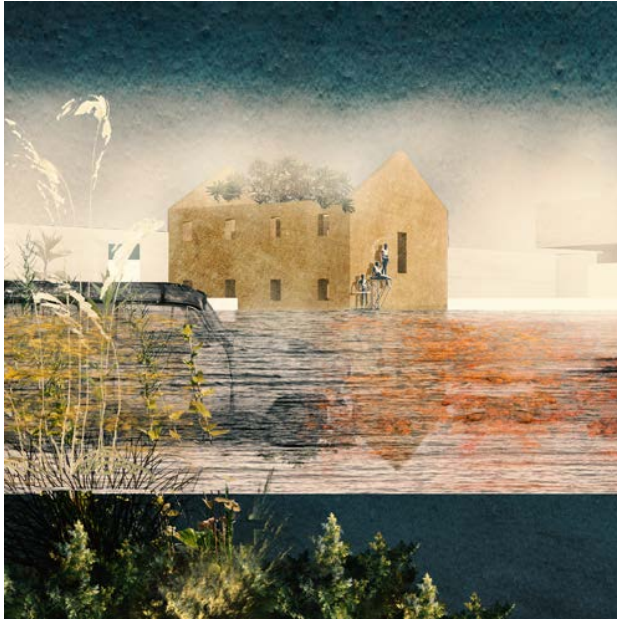
The inundation of the parking site