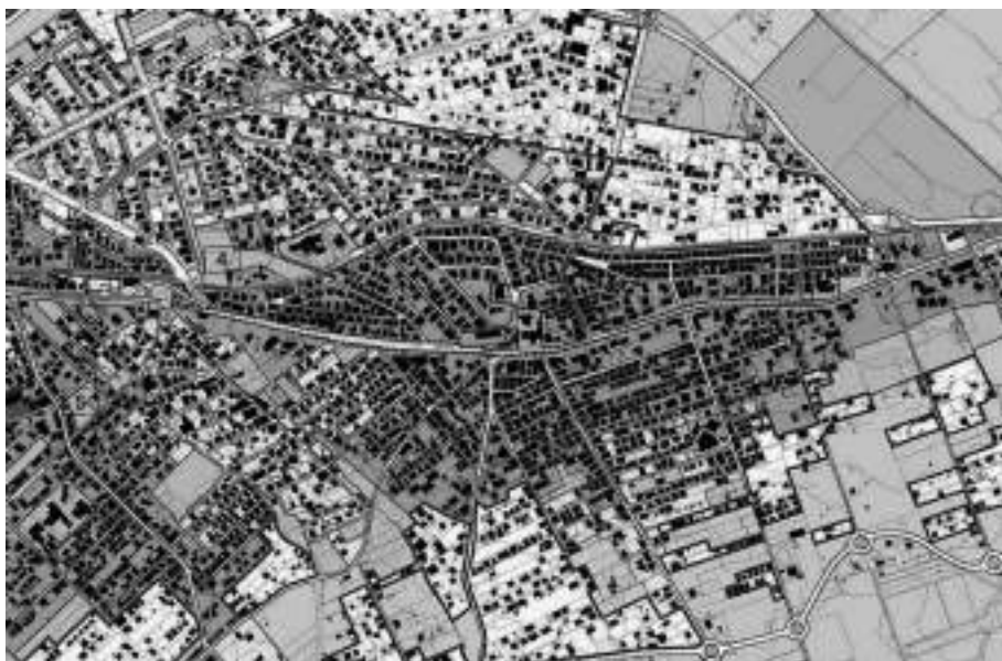
Fig. 2 Comune di Roma. PRG 2008. Elaborato Sistemi e Regole 1:10.000. Stralcio Lungo la via Casilina, che si sviluppa nella parte est del territorio romano, sono localizzati i «Tessuti prevalentemente residenziali della Città da ristrutturare» (nucleo in colore scuro), interessati dal Programma integrato “Borghesiana”, circondati da insediamenti abusivi sviluppatisi successivamente.

determinazione delle reali esigenze del territorio e della cittadinanza, sia nella fase di progetto definitivo, contribuendo operativamente al perseguimento del nuovo assetto individuato, attraverso la corresponsione di un contributo straordinario per l'attuazione delle opere pubbliche, la loro diretta realizzazione e/o la loro gestione.