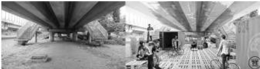
Fig. 6 Sotto il Viadotto. Progetto TUTUR ( http://tutur.eu/ ). Gruppo G124, con la collaborazione di Greenapsi, Associazione Interazioni Urbane.

Ad esempio, il Programma Temporary use as a tool for urban regeneration (TUTUR), facente parte del Progetto europeo URBACT, con riferimento al Comune di Roma, avvalendosi della collaborative map City hound 23 , ha individuato alcune aree e complessi edilizi pubblici sottoutilizzati in cui ha sviluppato progetti di riuso temporaneo, specialmente nelle aree interstiziali della città consolidata secondo tre linee di intervento: rifunzionalizzazione nell’attesa dell’avvio di grandi progetti di trasformazione, realizzazione di un micro-tessuto diffuso di servizi di quartiere, organizzazione della gestione e della manutenzione del verde urbano da parte di gruppi di cittadini. Il Programma Transitioning Towards Urban Resilience and Sustainability (TURAS) ha invece coinvolto un network europeo di Università, Imprese e Amministrazioni locali per affrontare le problematiche e alle potenzialità delle aree destinate a Parchi agricoli, muovendo dalle previsioni del PRG, sulla base di altre esperienze condotte a livello europeo.