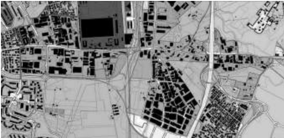
Fig. 3 Comune di Roma. PRG 2008. Elaborato Sistemi e Regole 1:10.000. Stralcio All'incrocio tra la via Prenestina e il Grande Raccordo Anulare (a nord della Via Casilina), sono localizzati i «Tessuti prevalentemente per attività della Città da ristrutturare», interessati dal Programma integrato “La Rustica”.

Essi costituiscono, come accennato, gli ambiti privilegiati per l'applicazione delle principali fattispecie di perequazione urbanistica e finanziaria introdotte dal PRG, in particolare: