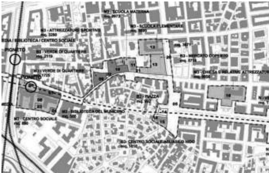
Fig. 5 Comune di Roma. PRG 2008. Elaborato «I2 Schemi di riferimento per le Centralità locali. Centralità VI-I Pignone». Stralcio. Le Centralità locali coinvolgono, in un progetto unitario, le componenti principali della città pubblica esistenti e previste: scuole, attrezzature collettive, verde e spazi pubblici.

Le Centralità locali possono costituire una risposta efficace alle problematiche fisiche e sociali dei contesti urbani degradati, sia periferici sia consolidati, relative principalmente alla strutturale carenza di città pubblica. In particolare, infatti, queste perseguono la riconfigurazione di spazi e di edifici pubblici, la rifunzionalizzazione di quelli in disuso, la realizzazione di nuove attrezzature pubbliche che ospitino funzioni e attività coerenti con le esigenze locali, il potenziamento di infrastrutture per il trasporto pubblico e per la mobilità privata, anche con interventi di mobilità sostenibile.