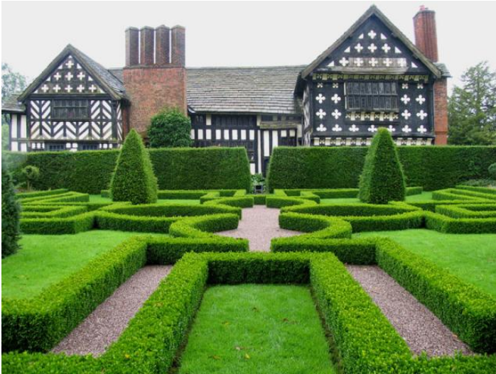
Aiuole bordate di bosso al Knot Garden di Little Moreton Hall, Cheshire, UK.