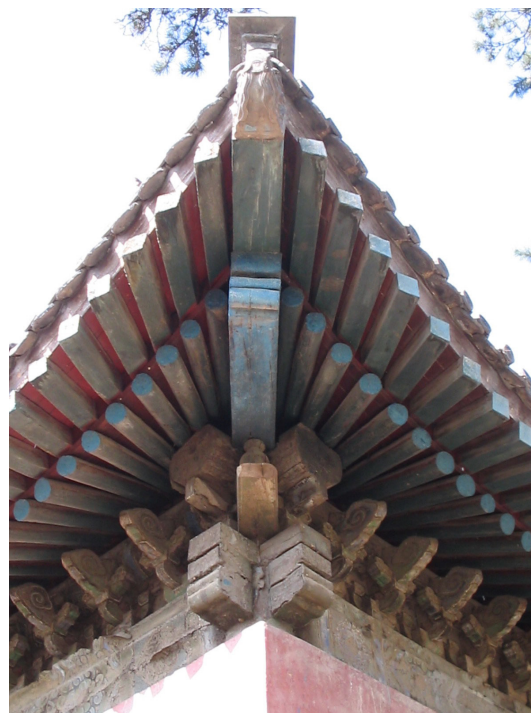
Fig. 6. Chengde (provincia di Hebei), il Tempio di Shuxiang, particolare della copertura lignea dell'edificio.