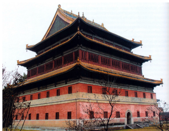
Fig. 4. Chengde (provincia di Hebei), il Tempio di Anyuan dopo l'intervento di restauro realizzato alla fine del 1983 con l'approvazione del Cultural Relic Bureau of the Ministry of Culture; nell'occasione furono quasi completamente ricostruiti gli edifici secondari del complesso e fu reintegrata la maggior parte delle strutture lignee della Pudu Hall

Ma in che modo l'idea di autenticità, estranea all'ambiente culturale e politico cinese fino a poche decine di anni fa, è ora recepita e interpretata? L'attuale esistenza di due differenti traduzioni del termine, testimonia dell'incertezza che ancora pervade l'intera riflessione sull'argomento 23 . Se da un lato la maggioranza degli studiosi utilizza il termine "yuanzhenxing", in cui "yuan" significa originario e "zhen" reale e affidabile-attendibile, interpretazione che sottolinea una prevalenza di interesse nei confronti dello stato originario di un edificio ("yuanzhuang"); altri ritengono più corretto affidarsi alla traduzione "zhenshixing", in cui la parola "zhenshi" sottolinea solo reale, vero e verificabile come nucleo di 'autenticità', osservando come l'utilizzo di "yuanzhenxing" limiterebbe