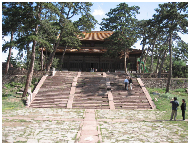
Fig. 5. Chengde (provincia di Hebei), il Tempio di Shuxiang; una delle poche costruzioni del Mountain Resort che ha conservato la maggior parte della sua originaria struttura. Per questo motivo il Chengde Cultural Heritage Bureau e l'Hebei Provincial Cultural Heritage Bureau, con l'assistenza tecnica della Chinese Academy of Cultural Heritage (CACH), hanno deciso di utilizzare l'edificio in un progetto pilota per lo studio e la conservazione delle sue strutture lignee dipinte, in applicazione dei China Principles.