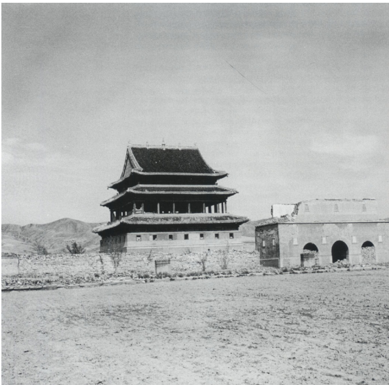
Fig. 2. Chengde (provincia di Hebei), il Tempio di Anyuan. Vista della costruzione principale del complesso templare, la Pudu Hall, in stato di abbandono negli anni Cinquanta. Il Tempio è parte del Chengde Imperial Mountain Resort and Outlying Temples, residenza estiva della dinastia imperiale Qing, costruita tra il 1703 e il 1792. Il sito, comprendente un vasto complesso di palazzi, edifici religiosi e amministrativi, immersi in un paesaggio di laghi, boschi e colline, è iscritto nella WHL UNESCO dal 1994 (da MICHELI, CHANGFA 2010, p. 265).