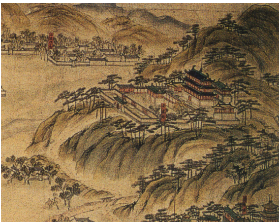
Fig. 3. Il complesso del Tempio di Anyuan in un dipinto storico del Mountain Resort (1764) (da FORET 2000, p. 145).

patrimonio monumentale, strettamente connesso a quell'identità culturale messa a repentaglio dalla rapida modernizzazione. Nel 1982 è stata pubblicata la prima legge nazionale Law of the People's Republic of China on the Protection of Cultural Properties 17 , ed è stata istituita l'autorità principale responsabile del patrimonio culturale in Cina, il Chinese State Administration of Cultural Heritage (SACH), con il compito di definire gli strumenti giuridici e le politiche nazionali per diffondere la conoscenza e controllare le pratiche di gestione del patrimonio (Figg. 2-4).