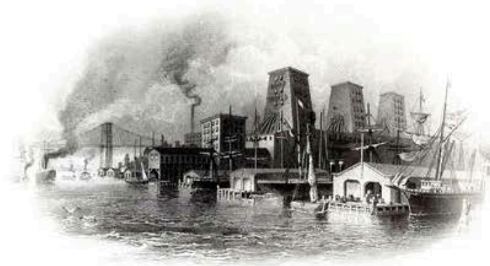
Fabbriche e magazzini lungo l'East River, 1850 ca.

Torniamo ora all'area abbandonata lungo il fiume. I cittadini di Brooklyn già nel 1984 formano associazioni a protezione dell'edificio dei traghetti Fulton (Fulton Ferry Landing) che all'inizio dell'Ottocento aveva permesso il collegamento che è alla base della creazione dello stesso quartiere come il primo grande "suburbio" americano. Le