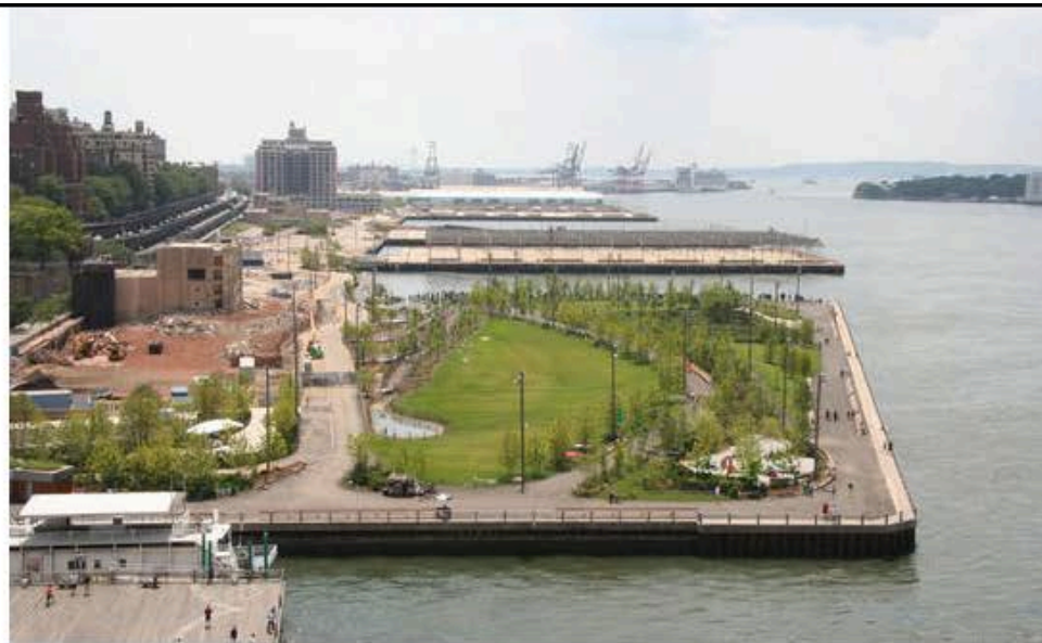
Sequenza di piattaforme artificiali sul fiume

storia) e dicono: “Stiamo costruendo la marina” e sono orgogliosi. E io penso: “Ah! La marina, ecco il sistema”. La marina vuol dire il porticciolo. La società che gestirà il porto turistico nel canale dello East River a New York non penso affitterà gratis i posti barca, giusto? Ma buona parte del capitale messo in anticipo è andato a pagare i campi da basket, che sono gratis! E sicuramente