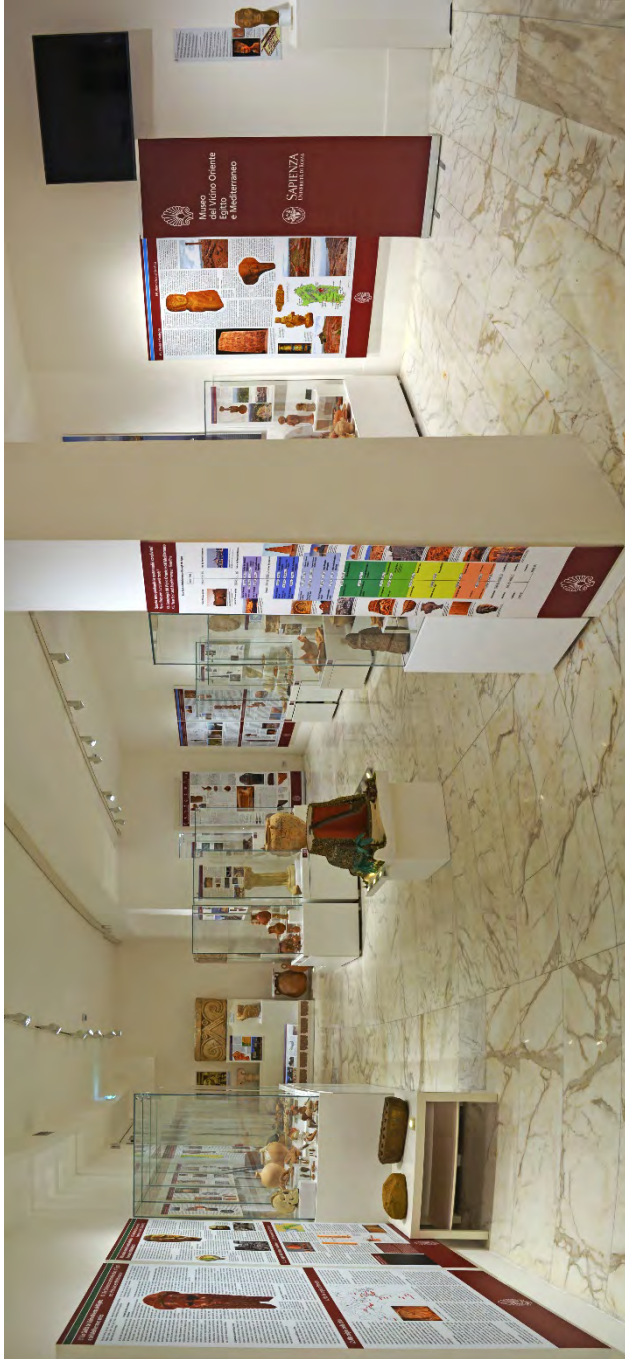
Fig. 1 - La collezione del Vicino Oriente e del Mediterraneo del MVOEM nella Sala a Crescente di Marcello Piacentini.