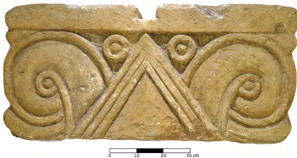
Fig. 8 - La ricostruzione completa di un capitello proto-eolico appartenuto alla facciata del palazzo interno alla Cittadella dell'VIII secolo a.C. di Ramat Rahel.