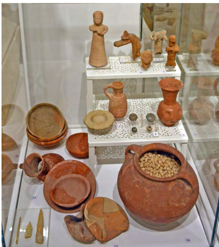
Fig. 7 - I reperti da Ramat Rahel dell'Età del Ferro esposti nella vetrina 7.