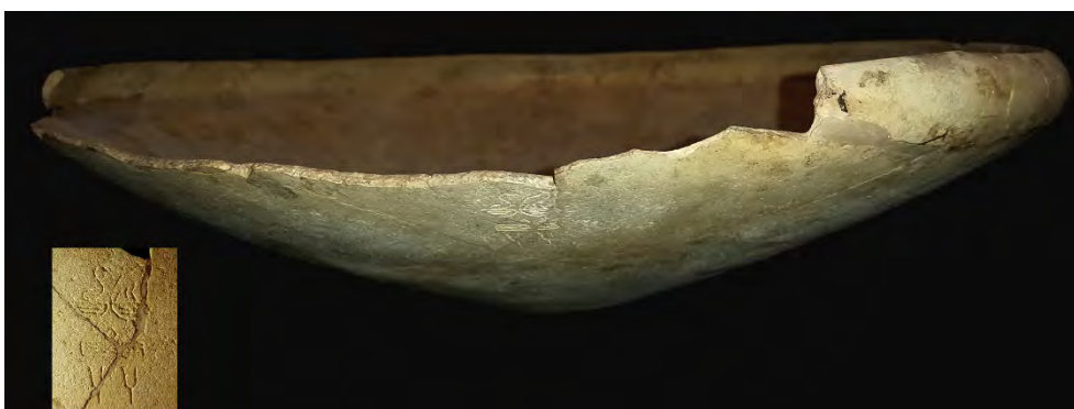
Fig. 23 - Il piatto in pietra tufacea giallo-ocra che reca, sotto l'orlo l'iscrizione del nome di Hotepsekhemwy.