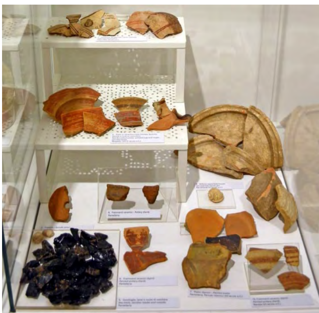
Fig. 11 - Alcuni reperti provenienti da Cipro, da Pantelleria, dalla Tunisia, dall'Algeria e dal Marocco esposti nella vetrina 11.