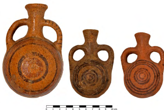
Fig. 6 - Brocchette cipro-fenicie in ceramica Red Slip dipinte con motivi di cerchi concentrici neri e rossi.