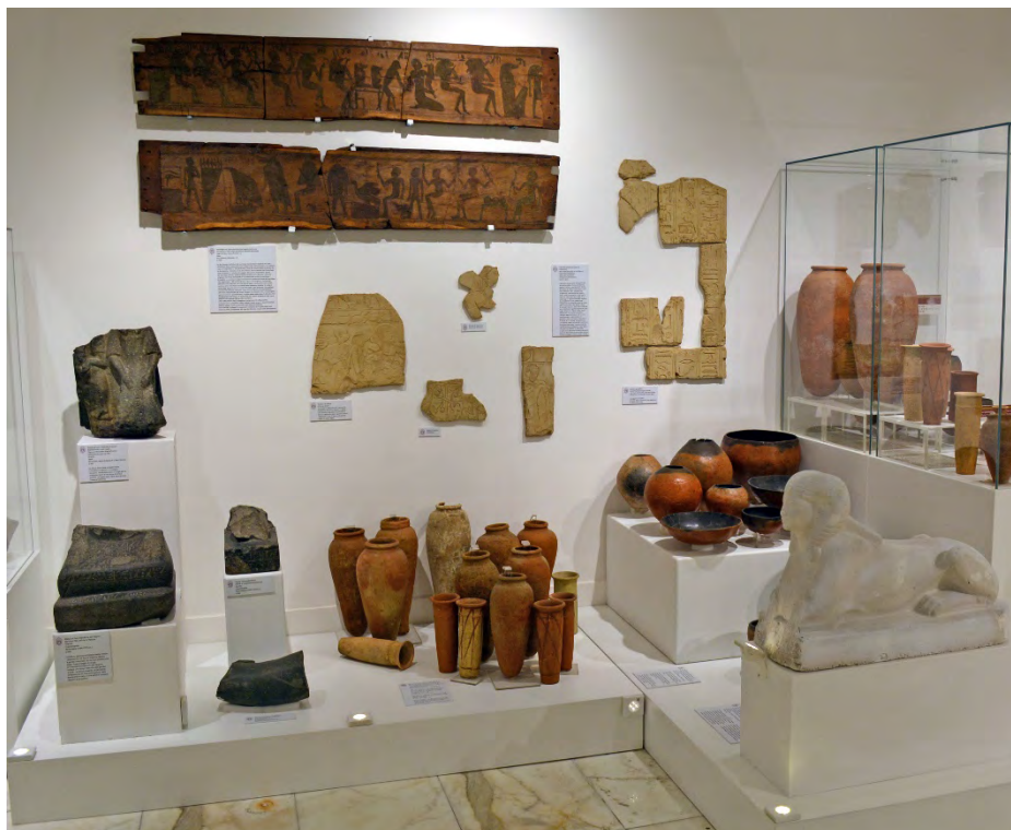
Fig. 16 - La pedana 4 sormontata da alcune copie di rilievi e iscrizioni geroglifiche della tomba di Sheshonq e dai due lati di un sarcofago ligneo dipinto, XXVI dinastia; alcune statue di funzionari di varia epoca (sinistra), i corredi delle tombe di Antinoe e Tamit (centro), e una copia in gesso della sfinge del regno di Thutmosis III (destra).