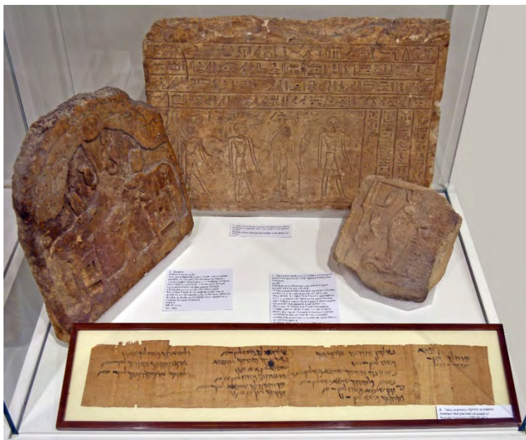
Fig. 22 - Le stele iscritte del Primo Periodo Intermedio (centro), d'età tolemaica (sinistra) e d'età romana (destra) e il papiro con un testo in aramaico del II secolo a.C., nella vetrina 28.