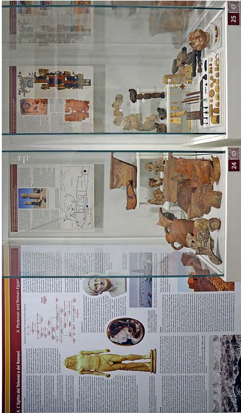
Fig. 20 - Le vetrine 24 e 25 dedicate ad Antinoupoli: la ceramica figurata e le figurine dipinte (a sinistra); i frammenti di tessuti di lino dipinti, avori e ornamenti (a destra).