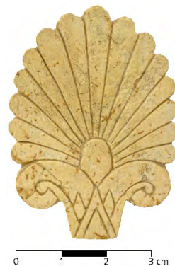
Fig. 14 - La palmetta eburnea rinvenuta nella necropoli di Monte Sirai, divenuta il simbolo del Museo.