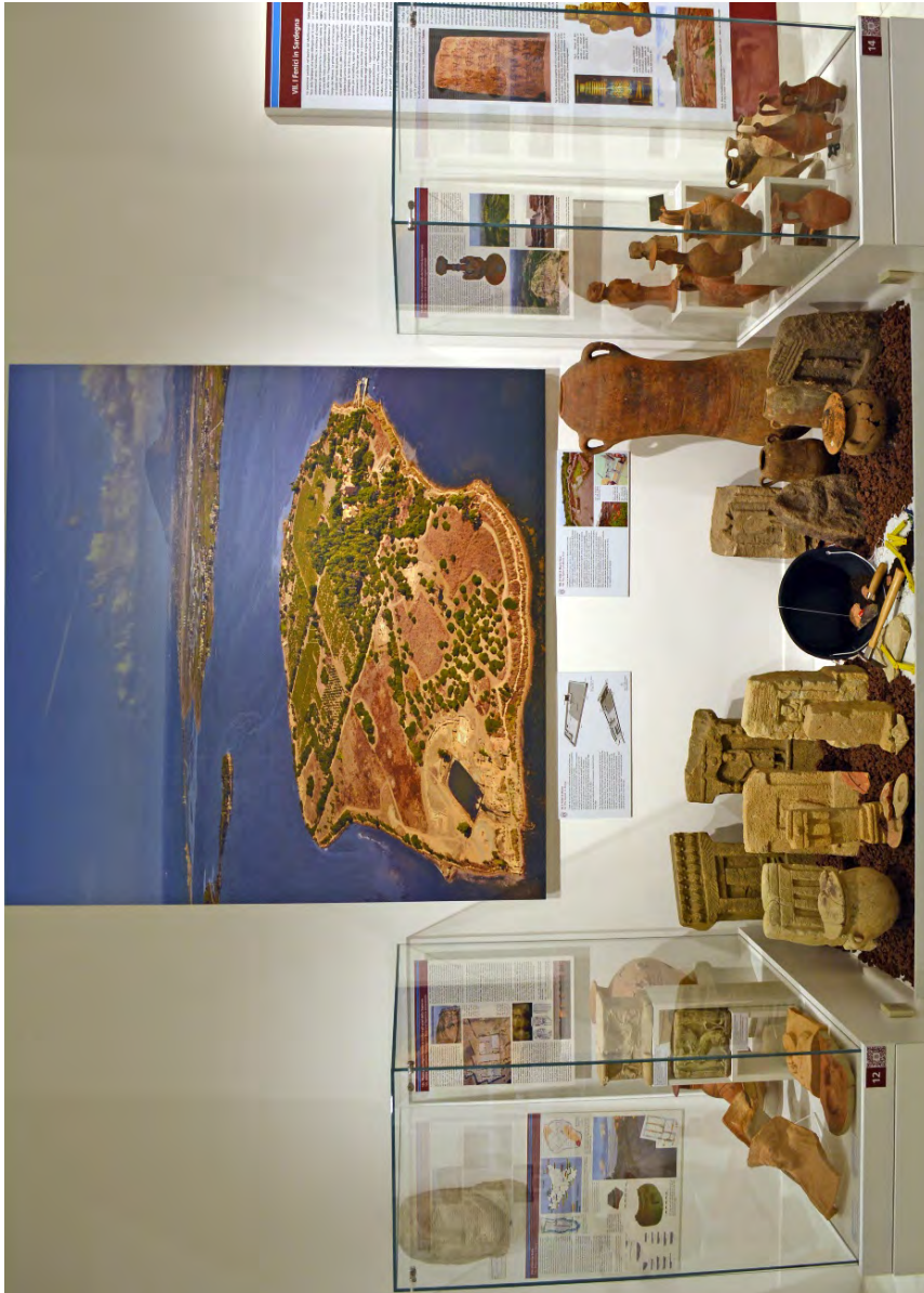
Fig. 13 - La pedana 3, sormontata da una grande foto aerea di Mozia, con la ricostruzione del Tofet di Mozia (sinistra) e del Tofet di Monte Sirai (destra).