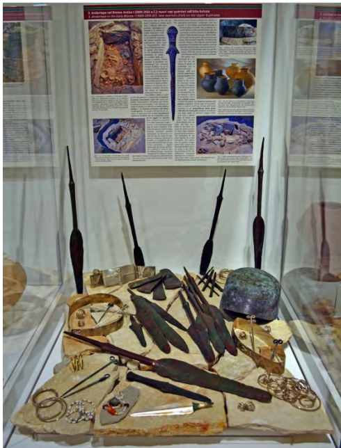
Fig. 5 - La ricostruzione della tomba e le repliche del corredo di armi e ornamenti appartenuti al principe di Arslantepe del Bronzo Antico I.