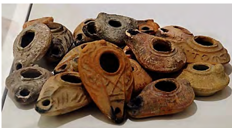
Fig. 10 - La collezione di lucerne di età bizantina e islamica da Ramat Rahel.