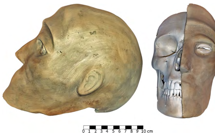
Fig. 3 - La riproduzione di teschio modellato del Neolitico Preceramico B di Gerico esposto nella vetrina 1.