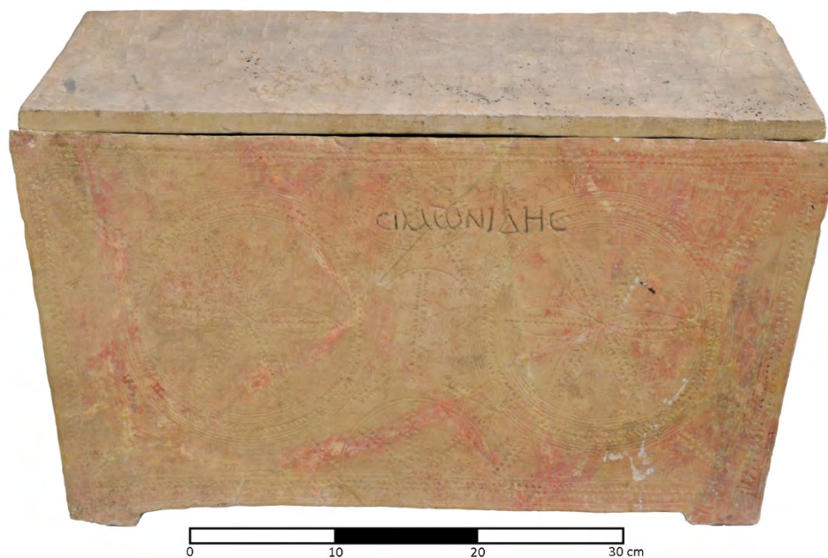
Fig. 9 - L'ossuario romano del I secolo d.C. con iscrizione ΣΙΜΩΝΙΑΔΗΣ da Ramat Rahel.