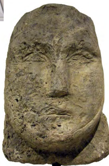
Fig. 12 - Testa di una statua schematica da Malta, III secolo a.C.