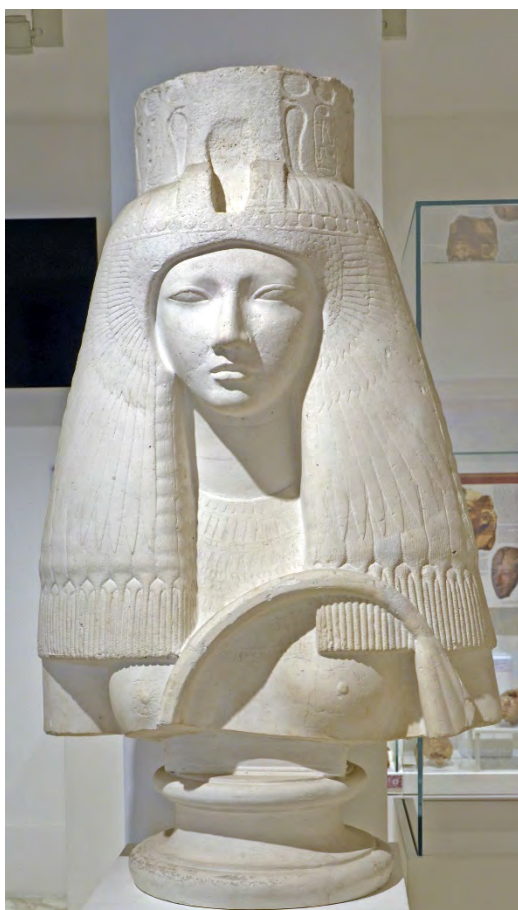
Fig. 15 - La copia in gesso del busto della statua della regina Tuya.