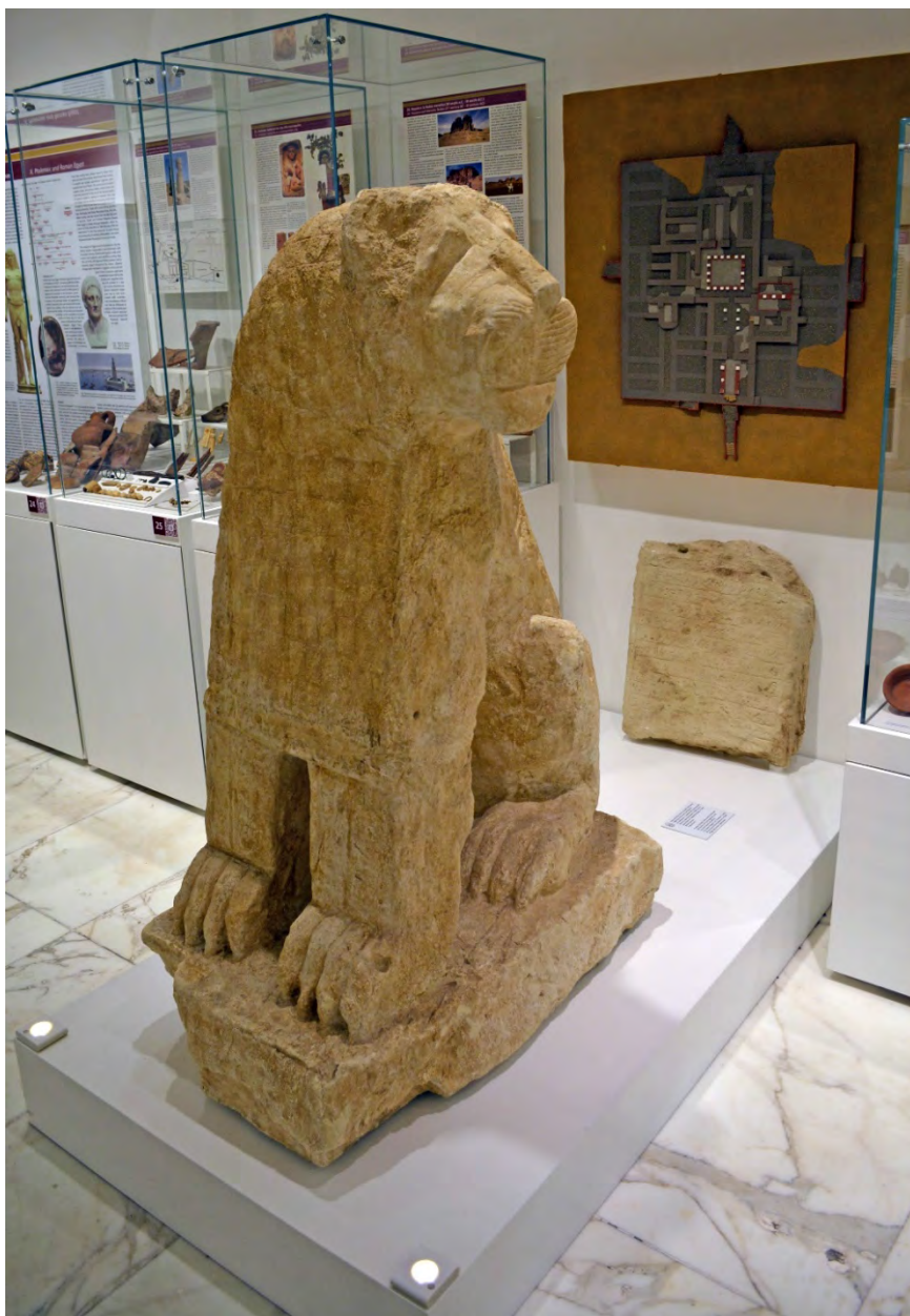
Fig. 21 - Il calco di un leone posto a guardia di uno degli ingressi del palazzo Jebel Barkal, in primo piano, e quello di una stele iscritta in meroitico, in secondo piano, sulla pedana 6; sulla parete il plastico del palazzo.