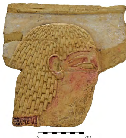
Fig. 17 - La riproduzione della testa di Sheshonq in un rilievo della Tomba 27 nella necropoli Assasif di Tebe, esposta nella vetrina 21.