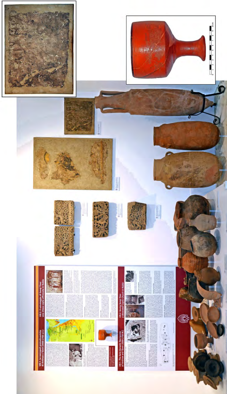
Fig. 19 - La pedana 5, dedicata alla chiesa di Sonqi Tino, dove sono disposti numerosi reperti, tra i quali il calice in ceramica (in basso) e il graffito con il nome del possibile santo titolare della chiesa, MIXALH (in alto).