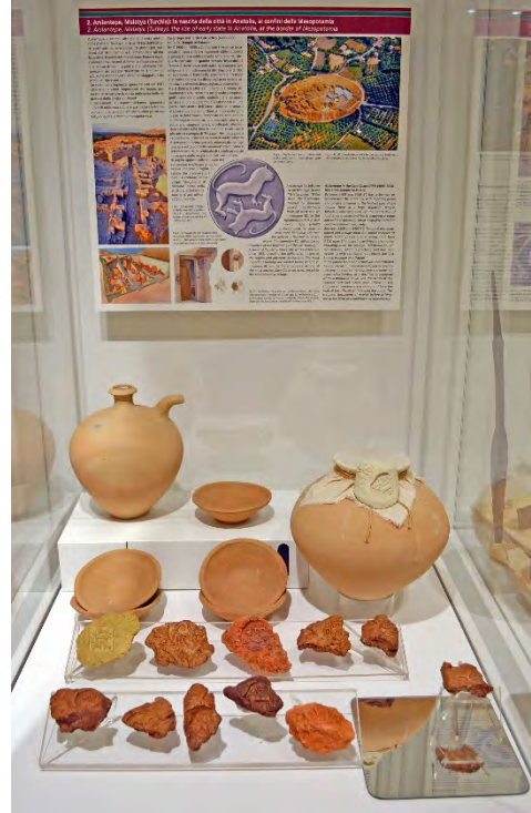
Fig. 4 - Le copie di alcune tra le più significative cretule e di alcuni vasi ritrovati nel palazzo Tardo Uruk di Arslantepe.