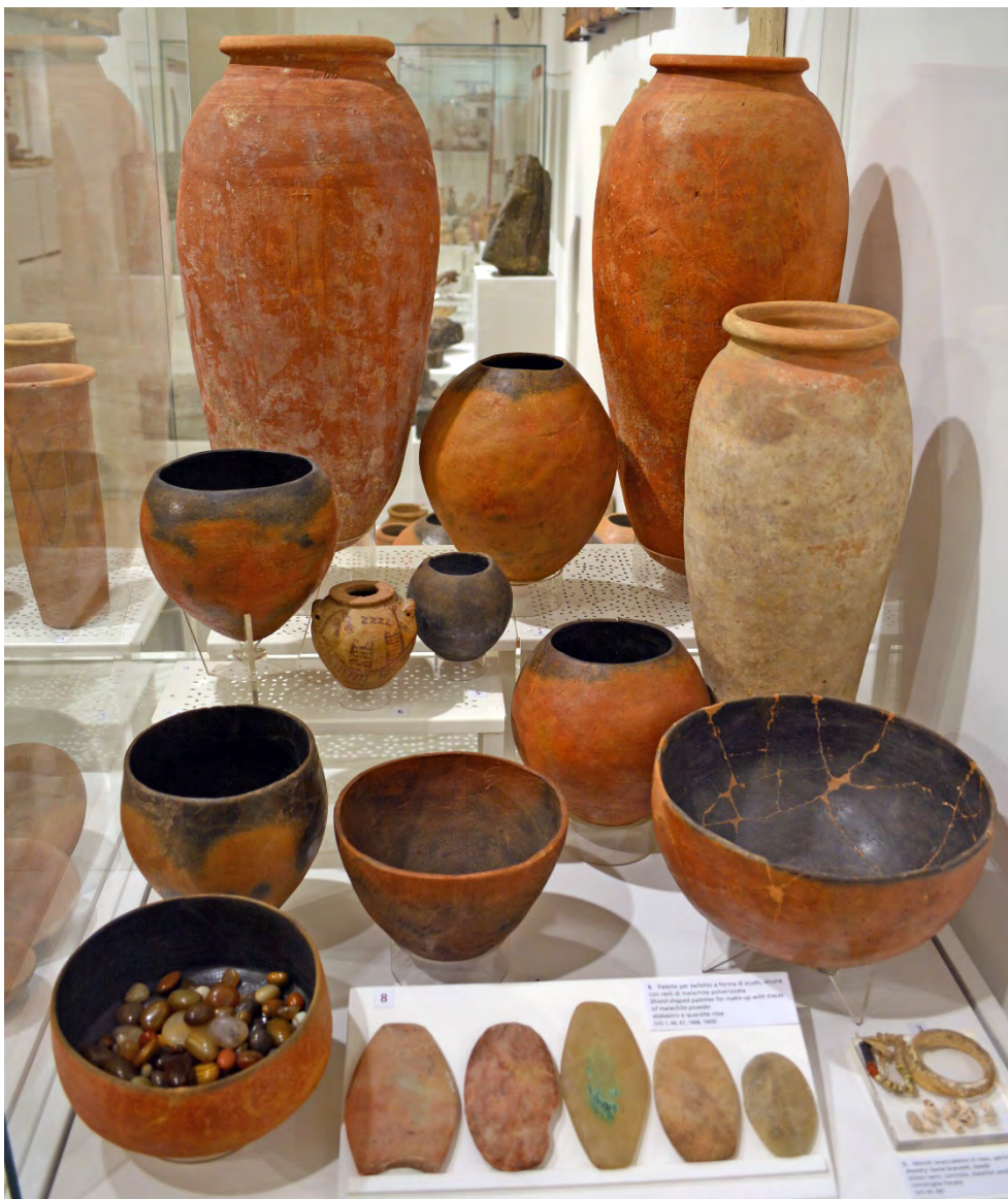
Fig. 18 - Alcuni elementi dei corredi della necropoli di Antinoe esposti nella vetrina 20.