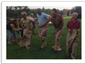
Immagine 24: Evento del programma intergenerazionale (Viterbo)