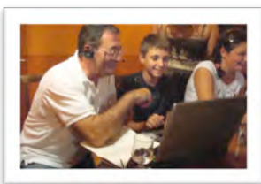
Immagine 7: osservazioni delle attività di laboratorio informatico (Viterbo)