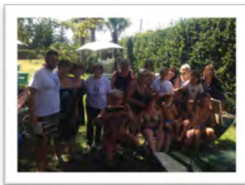
Immagine 3: Viterbo Terme