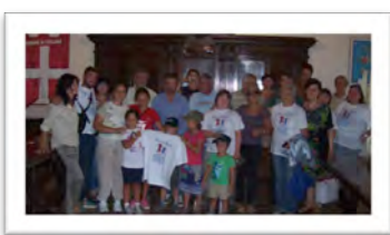
Immagine 17: Sala del Consiglio - Comune di Tuscania (Vt)