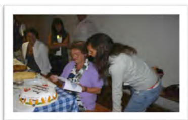
Immagine 8: osservazioni delle attività di tempo libero (Sfuz, Tn)