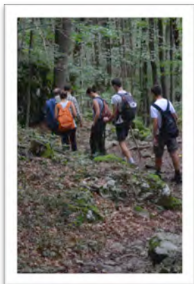
Immagine 5: San Pellegrino Terme

momenti di interazione del gruppo “Nonni e Nipoti”. La sperimentazione di turismo culturale intergenerazionale s’inserisce nei festeggiamenti del “settembre viterbese”, all’interno del quale la festa di Santa Rosa rappresenta un appuntamento di grande valore storico-culturale, religioso e folkloristico per la comunità locale.