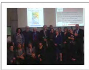
Immagine 16: Università degli Studi di Brescia