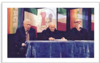
Immagine 25: Sostegno sociale istituzionale (Viterbo)

8) I progetti intergenerazionali in generale possono prevedere diverse forme di scambio (ad es. giovani a servizio degli anziani, anziani a servizio dei giovani, insieme per un obiettivo comune, ecc.). Secondo voi quali forme di scambio funzionano meglio e perché?