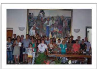
Immagine 18: Sala del Consiglio - Comune di Marta (Vt)