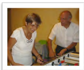
Immagine 9: osservazioni delle attività di

della ricerca-sperimentazione. Rispetto alle motivazioni a intraprendere la nuova esperienza, la curiosità e il desiderio di un arricchimento personale nell'incontro con i giovani sintetizzano in modo chiaro l'atteggiamento dei partecipanti all'iniziativa: gli anziani non solo si rivelano come persone curiose e aperte alle novità, ma si rappresentano desiderose di mettersi in gioco e di misurarsi in nuove situazioni quali l'apprendimento dello strumento informatico e l'interazione con i giovani nelle escursioni e nel tempo libero.