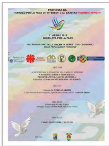
Immagine 13: presentazione evento “Canti di guerra e semi di pace” (Viterbo)

compito, con rigida assunzione di ruoli che ha lasciato poco spazio allo scambio creativo ed empatico. Gradualmente, è avvenuto l'avvicinamento nella coppia, favorito dalla nuova immagine di sé nel processo di apprendimento delle nuove tecnologie da parte dei nonni; ciò ha portato a percepire i nipoti non più come out-group, ma come partner attivi dell'interazione, con i quali intraprendere una comunicazione più dinamica e profonda. Si registra quindi il progressivo andamento decrescente degli elementi relativi alla sfera cognitiva, a favore di un incremento degli aspetti empatici, fino a raggiungere, in alcune edizioni, la forbice che nella terza fase evidenzia l'inversione delle frequenze percentuali, in base alla quale le dinamiche di relazione empatica prevalgono nettamente sulle dinamiche di relazione cognitiva.