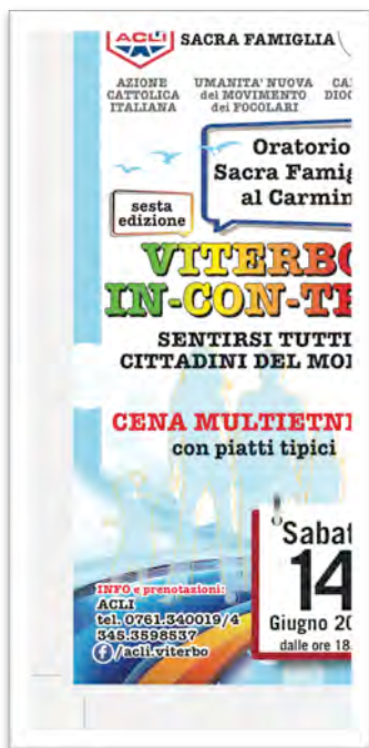
Immagine 12: presentazione evento “Viterbo In-con-tra”