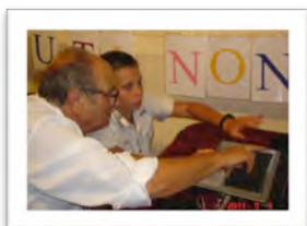
Immagine 6: osservazioni delle attività di laboratorio informatico (Viterbo)

-San Pellegrino Terme è una cittadina termale; si caratterizza per un passato storico-artistico glorioso che ne caratterizza ancora l’insediamento urbanistico-architettonico. La vicinanza con la Valle Taleggio è una risorsa importante perché questa valle offre notevoli possibilità di escursioni turistiche ‘dolci’ in un ambiente incontaminato e lontano dal turismo di massa. Da segnalare inoltre la vicinanza con i luoghi di Arlecchino e dei Tasso. La presenza del centro termale costituisce una nuova risorsa per il turismo, meta e contesto di riferimento anche per il gruppo intergenerazionale. La sinergia con la realtà locale e con l’Istituto Alberghiero, come già evidenziato, favorisce al gruppo di sperimentare una serie di attività laboratoriali durante i periodi di vacanza e di produrre un ipertesto frutto delle esperienze vissute. Il turismo intergenerazionale programmato per la prima settimana di settembre 2015 sarà connesso agli obiettivi dell’Expo 2015.