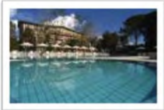
Immagine 4: Benetutti Terme