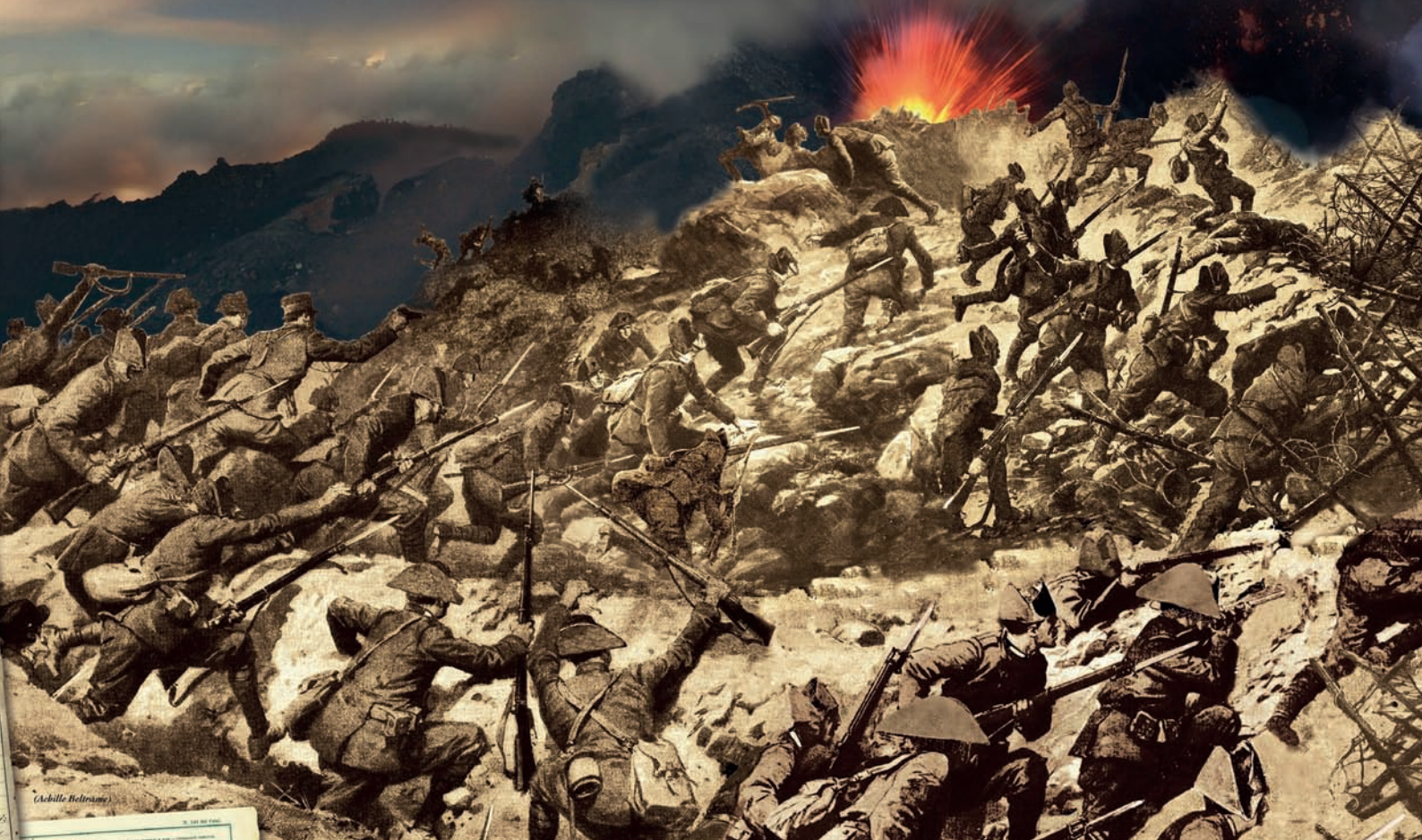
Una pagina del Calendario Storico dei Carabinieri, 2013

costituita da 28 Ufficiali e da 1256 uomini di truppa su tre Battaglioni, più una Sezione mitragliatrici. Nell'illustrazione di queste pagine, ricavata da disegni di Achille Beltrame, il momento dell'attacco alla quota 240 dell'altura del Podgora. Il Comandante della Brigata "Pistoia", dopo la battaglia, annotò nel suo Diario di Guerra: "I Carabinieri stettero saldi e impavidi sotto la tempesta di piombo e di ferro che imperverava da ogni parte".