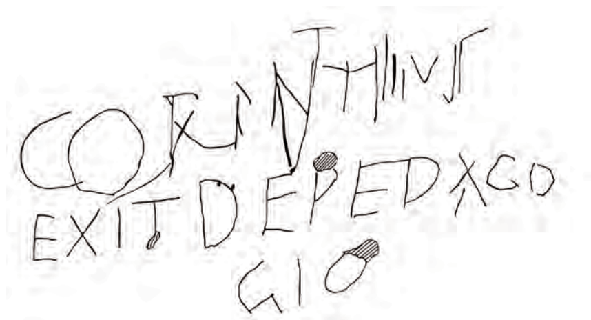
Fig. 3: Graffito edito da Solin, Heikki; Itkonen-Kaila, Maria (1966), nr. 70 = EDR183206. Ricostruzione di A. Mincuzzi.

delle iscrizioni parietali di Pompei ed Ercolano 60 . Affinando la ricerca, ossia selezionando Roma come città di ritrovamento dei documenti, è indubbio che la digitalizzazione dei graffiti urbani sia ancora incompleta. Entro Marzo 2022, nella banca dati erano confluite poco più di 150 iscrizioni urbane, a fronte del migliaio di documenti di questo tipo finora noti 61 . Ad eccezione dei graffiti parietali dell' Excubitorium 62 , oggetto di una schedatura completa e puntuale, le altre iscrizioni sono state oggetto di una schedatura sporadica, e risultano pertinenti a contesti che il database ha accolto solo parzialmente. Convinti che i graffiti parietali di Roma meritino maggiore attenzione, data la loro importanza per gli stu-