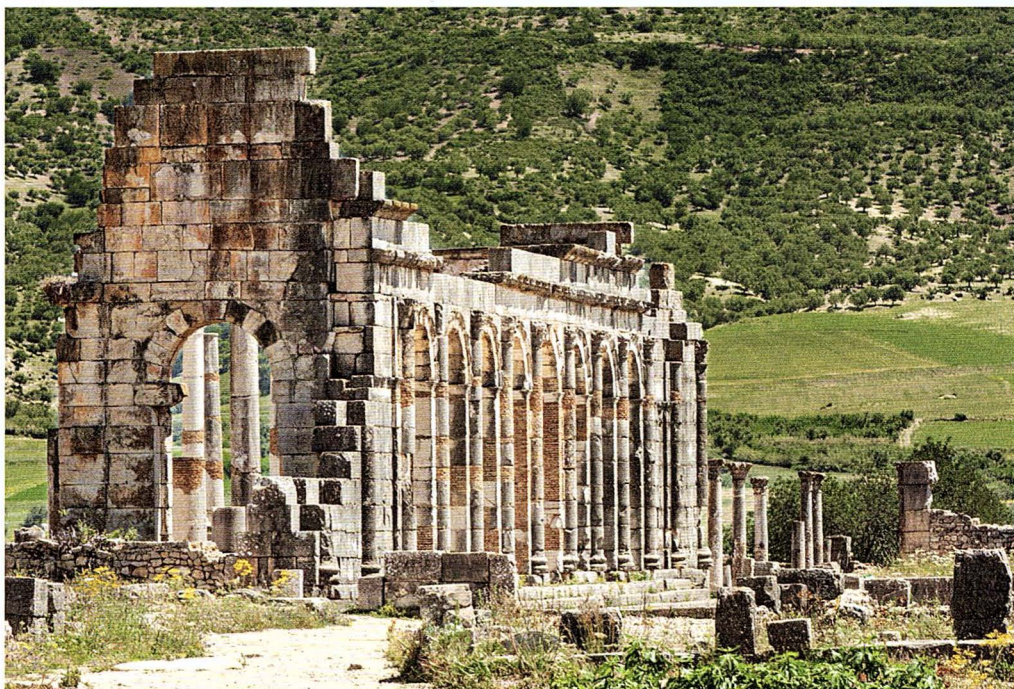
B Basilica di Volubilis, III secolo d.C. Volubilis (Marocco).