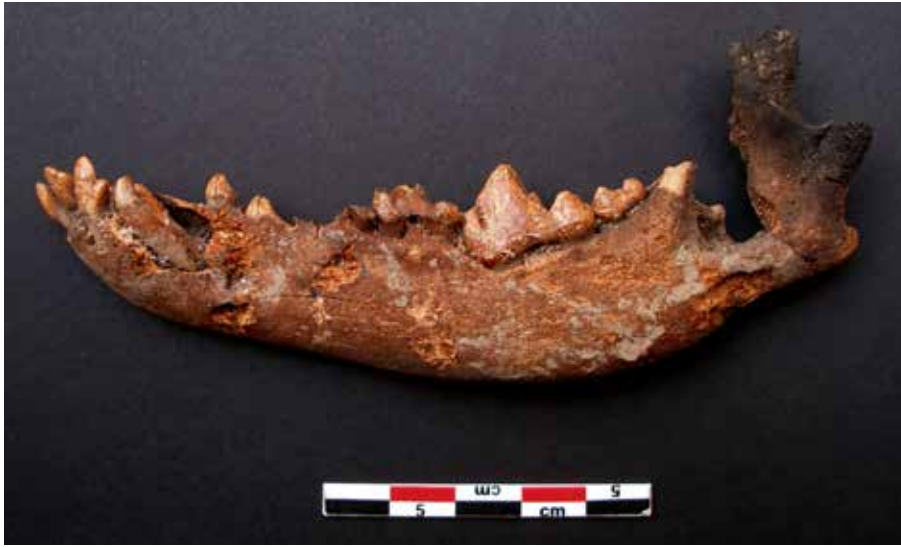
Mandibola di cane sub-adulto con tracce di combustione e tracce di macellazione provocate da uno strumento di pietra. Mandible of a juvenile dog with charring traces and cut marks left by a flint tool.

In Oman, questa strategia alimentare è stata riscontrata in siti, soprattutto Neolitici, legati allo sfruttamento stagionale delle risorse marine, dove il consumo occasionale di carne di cane poteva essere più conveniente rispetto al mantenimento di mucche, pecore e capre o alla caccia agli animali selvatici.