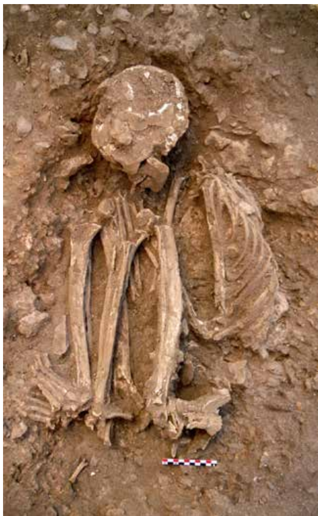
Una delle sepolture singole della necropoli neolitica. One single burial of the Neolithic graveyard.

Nella pagina precedente/ on the previous page . Foto aerea dell'area di scavo realizzata durante la campagna 2014. Aerial Photo of the excavated area taken during the 2014 campaign.