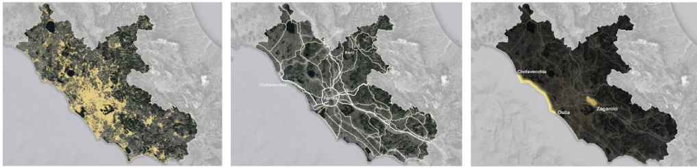
Fig. 1. Analisi del sistema insediativo e relazionale della Regione Lazio con localizzazione dei casi di studio.

per lo più intorno a piccoli villaggi di pescatori. La comodità dei collegamenti, unita alla maggiore convenienza economica e alla vicinanza al mare, ha favorito un'urbanizzazione sregolata, che si è estesa su tutta la fascia dunale fin sopra la spiaggia, alterando l'ambiente naturale, frammentando preziosi ecosistemi e influenzando sui processi idrogeologici. Se d'estate sono investiti da flussi turistici prevalentemente giornalieri provenienti dalla Capitale, durante il resto dell'anno i flussi hanno direzione opposta, alimentati dal pendolarismo degli abitanti stabili i cui interessi gravitano sul grande centro.