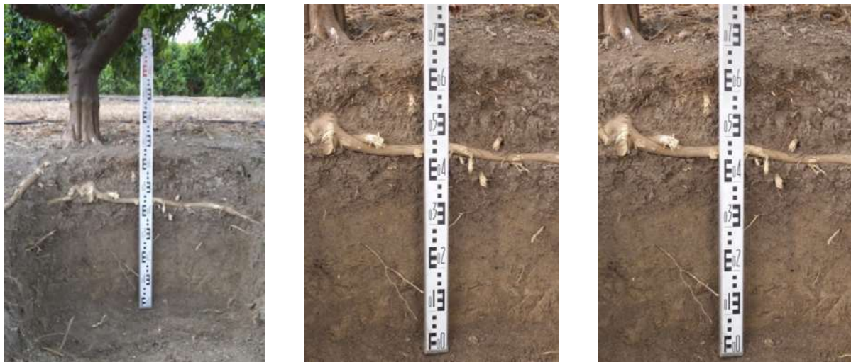
Figura 5. Ejemplo de perfil de suelo en el cultivo con mangos.

nodular. Finalmente, aparecen algunas raíces: de forma frecuente, horizontales y medianas en los dos primeros horizontes, pero muy pocas en profundidad.