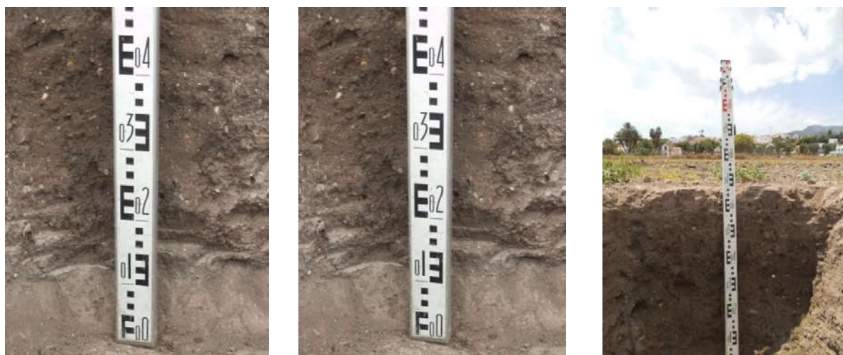
Figura 3. Ejemplo de perfil de suelo en el cultivo con aguacates.