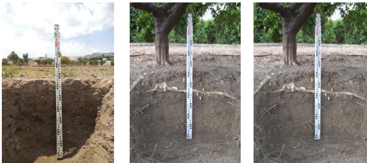
Figura 4. Ejemplo de perfil de suelo en el campo cultivado con mangos.