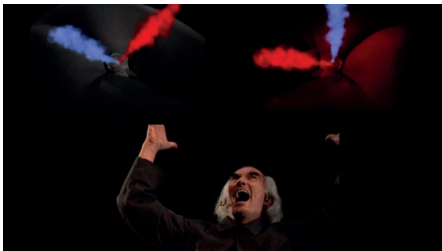
Un avatar del diavolo , foto di scena, “La recherche de la fécalité”.