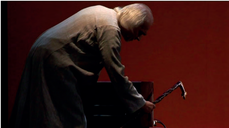
Un avatar del diavolo, foto di scena, “Conclusion”.