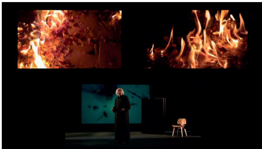
Un avatar del diavolo , foto di scena, “La recherche de la fécalité”.