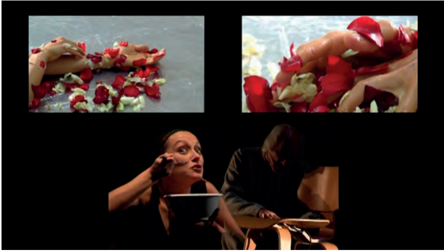
Un avatar del diavolo, foto di scena, “La question se pose de...”.