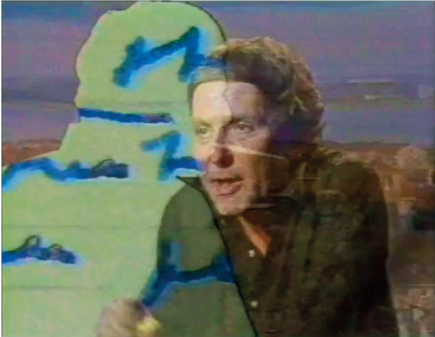
Fig. 2: Sollers au Paradis , DVD, Art Press, 2007, (0.42.09).

Il faut que je me place dans la dimension où je verrais mon corps au-dessous de moi, [...] dormant profondément, et moi avec ma voix, au-dessus de plus en plus agile et rapide pour ce corps qui s'endort, disparaît au plus profond du sommeil, image de la mort [...] 64 .