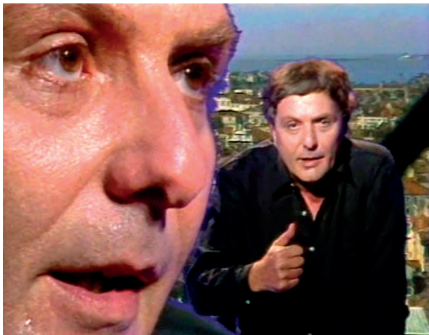
Fig. 3: Sollers au Paradis , DVD, Art Press, 2007, (0.24.10).

l'uscita, egli decide di darne una lettura pubblica filmata, Sollers lit Paradis II 65 (1986). Questa volta la scenografia è totalmente diversa. Sullo sfondo appaiono immagini fisse, libri disposti a blocchi sugli scaffali di una biblioteca (la realtà contingente) e in primo piano soltanto il volto di Sollers, l'articolazione della sua bocca mentre recita, i suoi gesti, il viso, la sua figura intera: il suo corpo. È il corpo dello scrittore e non la sua immagine, sottolinea Sollers: