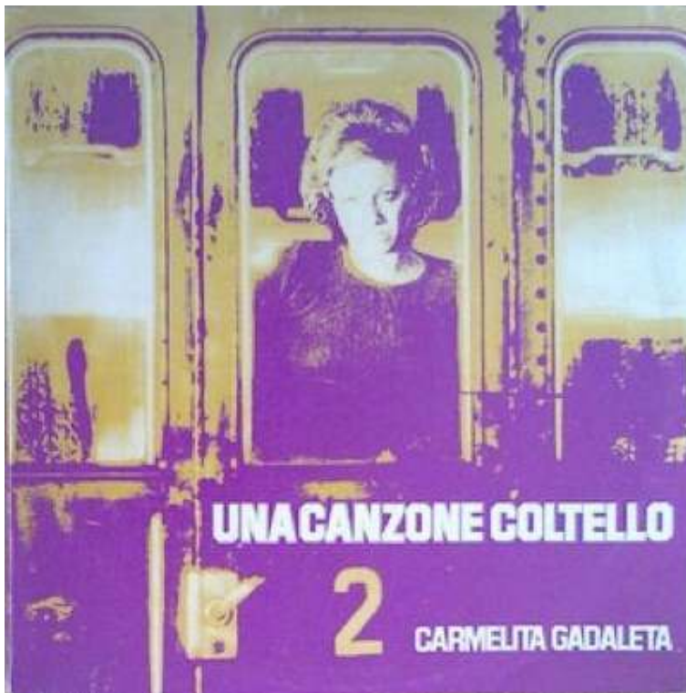
Una canzone coltello (1975), de Carmelita Gadaleta