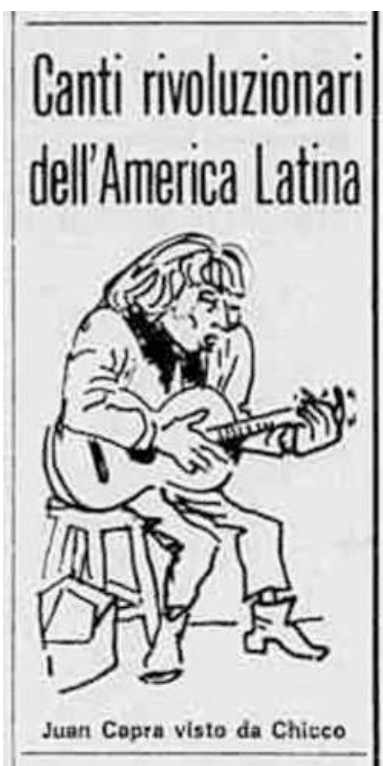
Caricatura de Juan Capra, publicada en el diario torinés La Stampa , 15/06/67