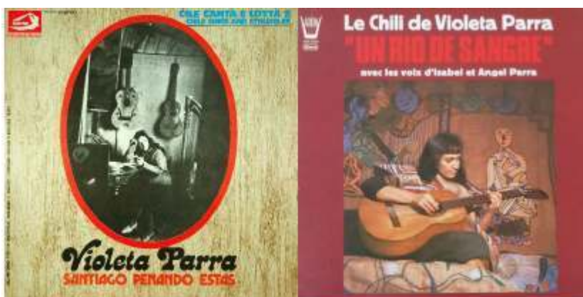
Portadas de los discos "gemelos" derivados de Canciones reencontradas en París : a la izquierda, la edición italiana del disco Santiago penando estás (gentileza de Livio Busato) y a la derecha, la edición francesa de Un rio de sangre (gentileza de Girolamo Garofalo), que Arion publicó también en Italia, con comentarios traducidos al italiano.