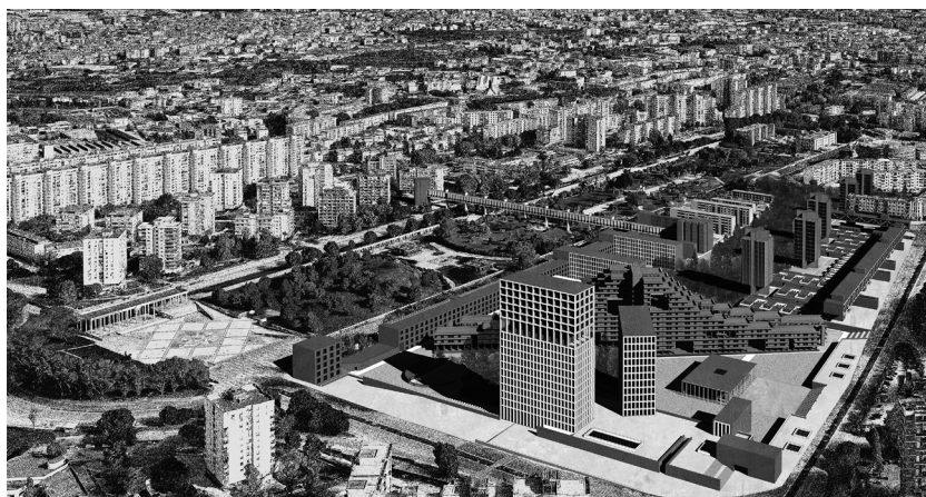
Fig. 3 | Vista a volo d'uccello della soluzione progettuale nell'intorno urbano (disegno dell'A.).

6 Il progetto Restart Scampia, da margine urbano a nuovo centro dell'area metropolitana, è risultato vincitore del bando ministeriale del 2016 per la riqualificazione delle periferie. In quella sede il Comune, in accordo con un folto gruppo di ricerca dell'Università degli Studi di Napoli Federico II, ha predisposto sei azioni progettuali e quattro indirizzi operativi che, seppur mediante schemi diagrammatici, propongono delle linee guida la riqualificazione del quartiere.