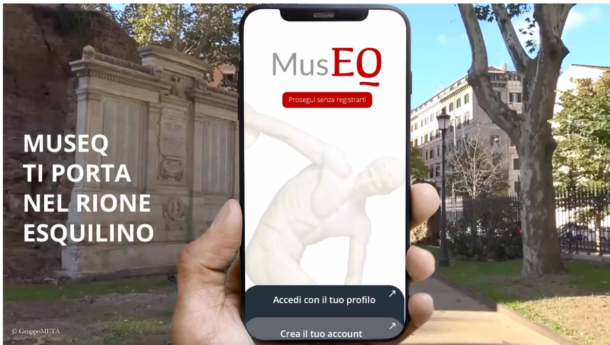
Fig. 2 L'applicazione digitale MusEq consente di collegare le opere conservate nei Musei Capitolini e nel Museo Nazionale Romano con i luoghi in Esquilino da cui sono state estratte, ma anche complessi monumentali e vita socio-economica del Rione, grazie ad alcune soluzioni in realtà aumentata (© Gruppo META)

Grazie al lavoro di EcR svolto da ottobre 2020 anzitutto con gli amministratori di condominio di tutta la piazza, i privati proprietari di alcuni immobili hanno deciso, in sede condominiale, di avviare il recupero complessivo di due facciate fra le più degradate della piazza, nel tratto fra via Mamiani e via La Marmora, fruendo così della cooperazione fra i rispettivi progettisti, imprenditori e tecnici consulenti, con l'ausilio di ricercatori dell'università, nel definire con gli uffici autorizzanti il percorso tecnico-amministrativo unitario della complessa operazione. I portici, infatti, hanno un carico di utenza altissimo e complesso, così che la sola installazione dei ponteggi pone questioni organizzative non indifferenti. La componente universitaria di EcR ha contribuito attivamente alla comprensione storico-critica della piazza e dei suoi edifici, fornendo i risultati di studi, ricerche e rilievi condotti da docenti e ricercatori di "Sapienza" Università di Roma ed elaborazioni grafiche curate dagli studenti del corso di laurea in Architettura.