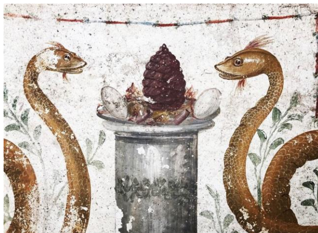
Figura 3. Domus della Regio V di Pompei, dettaglio serpenti.

Il Genius Loci , come ogni entità geniale, era considerata come una divinità a tutti gli effetti e come tale, secondo la concezione romana, poteva essere di genere femminile o maschile. Il fatto che venissero rappresentate due serpi con tratti fisici e cromatici ben distinti dimostra l'incertezza circa il genus ( Sesso ) della divinità geniale del luogo. Sono due le ragioni possibili per cui il Genius veniva raffigurato in questo modo: per precauzione o per richiedere assistenza e protezione a entrambi.