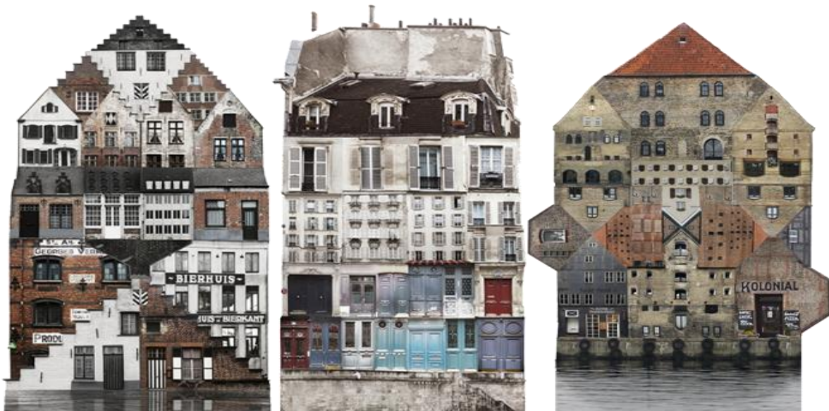
Figura 1. Anastasia Savinova, Genius Loci : Patchwork di pezzi di città, l'artista cerca di unire in un'immagine l'atmosfera e lo spirito del luogo.