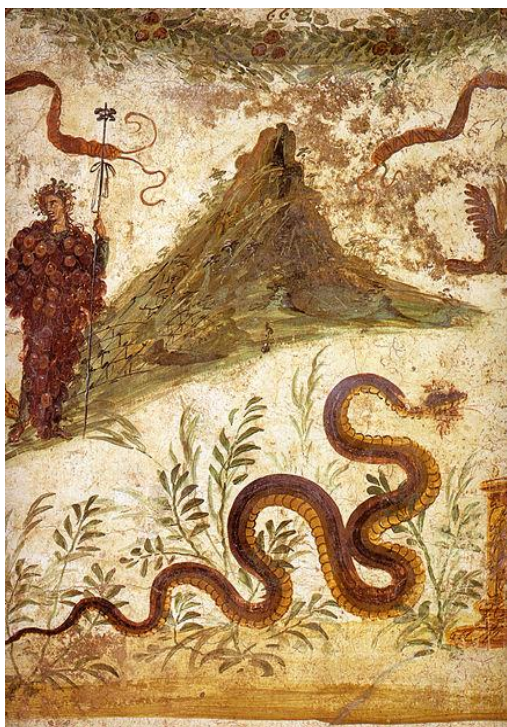
Figura 2. In questa pittura murale pompeiana del 70 a.C. la divinità accanto al Vesuvio è Bacco, forse relativo alle vigne delle pendici del vulcano, e il Genius Loci è rappresentato dal serpente.

Il Genius ha rapporti con il mondo sotterraneo oltre ad avere la funzione di protettore e generatore, tanto che frequentemente viene identificato con i Lari che, nella loro concezione più antica, rimandano all'anima dei morti di cui si aveva timore per l'eventualità che riconquistassero il mondo dei vivi. Esso poteva apparire come umano o come animale, come il cervo, attributo di Diana, la civetta, sacra a Minerva, o la colomba, sacra a Venere. Gli antichi Geni erano alati, come immagine non corporea, per la loro capacità di sottrarsi alle rigide categorie umane del tempo-spazio.