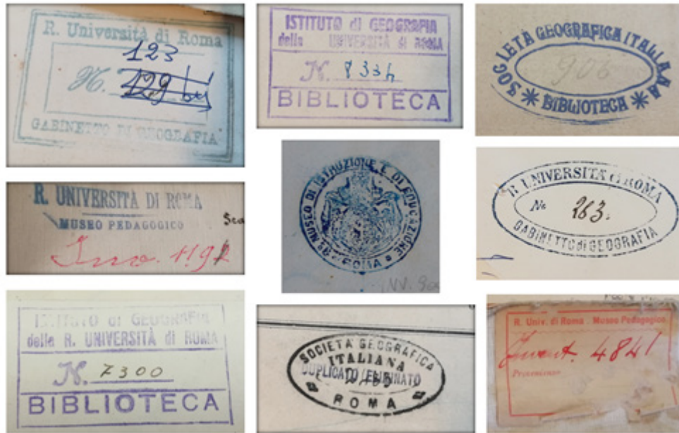
Figura 1. Timbri vari presenti sulle carte dell'ex Istituto di Geografia. Si noti in basso a destra quello della Società Geografica Italiana con la dicitura «duplicato eliminato».

La varietà dei timbri inventariali presenti soprattutto sul materiale cartografico è segno tangibile dei legami con tali istituzioni. La ricostruzione dei movimenti che hanno portato alla costituzione del posseduto fornisce indicazioni preziose sul contesto in cui è nato e ha operato il Gabinetto di Geografia. Gli oggetti muovendosi tra sedi accademiche, case editrici, enti pubblici e privati, coinvolgendo professionalità varie, hanno determinato una rete di relazioni spesso sommerse e non facili da rintracciare. L'attenta analisi delle fonti bibliografiche e di quelle archivistiche si rivela fondamentale non solo per comprendere le logiche che hanno determinato la costituzione delle collezioni, e quindi il quadro teorico-epistemologico di riferimento, ma anche per ricostruire fatti, rapporti, eventi, consuetudini, espressione del contesto locale quale produttore di conoscenza geografica «radicata negli spazi e nei luoghi in cui si è alimentata» (Serenò, 2019, p. X).