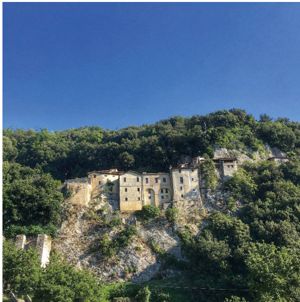
Fig.3 Santuario di Greccio, 2021