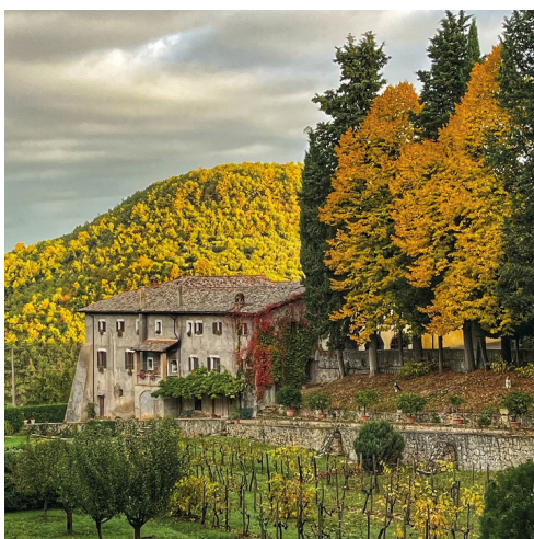
Fig.5 Santuario de La Foresta, 2023