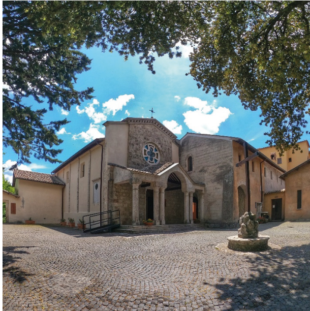
Fig.2 Santuario di Fontecolombo, 2020