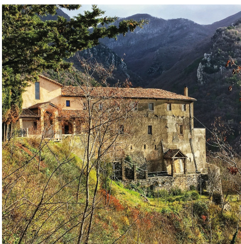
Fig.4 Santuario di Poggio Bustone, 2022

La natura viva e protettrice fornisce riparo a Francesco nelle rocce del Santuario S. Giacomo a Poggio Bustone in cui ha inizio la sua predicazione peregrinante invitando i suoi confratelli alla prima missione per il mondo all'insegna della riscoperta dei valori della povertà, della semplicità e dell'amore. Dove era situata l'originaria chiesetta di San Giacomo sorge il santuario, già dal 1235 circa, più volte nei secoli rimaneggiato, sempre nel rispetto di quella povertà anelata dal Santo con tipologia edilizia "povera e spoglia". Risalendo un sentiero nel fitto bosco, ove si trovano sei cappelle erette intorno al 1650 a ricordo di vari miracoli, si giunge al Sacro Speco o grotta delle Rilevazioni, inglobata successivamente in una chiesetta incassata sotto una massa rocciosa, nascosta dal bosco. Di ritorno verso Rieti si scopre il quarto Santuario S. Maria de La Foresta immerso nella vallata in cui scorre il torrente dell'Acqua Marina e circondato da folta vegetazione, boschi di castagni, di roveri e da ampie coltivazioni mantenute dagli stessi frati. Il luogo ai tempi di Francesco era formato dalla chiesina, dalla canonica e dalla domus poi i frati romiti ne iniziarono la trasformazione erigendo una chiesa, più ampia risalente al XIV secolo, che ruota attorno al chiostro quattrocentesco, da cui si accede allo Speco.