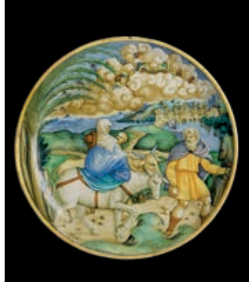
Fig. 7. Fuga in Egitto , Coppa in maiolica, Oxford, Ashmolean Museum