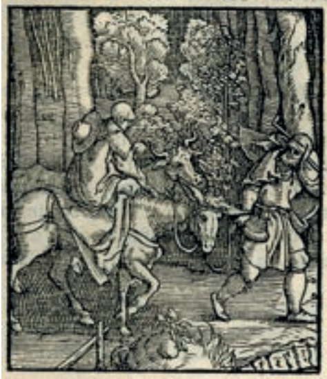
Fig. 6. Fuga in Egitto , in Contemplatio totius vitæ et passionis Domini nostri Iesu Christi , p. 26, Roma, Biblioteca Universitaria Alessandrina