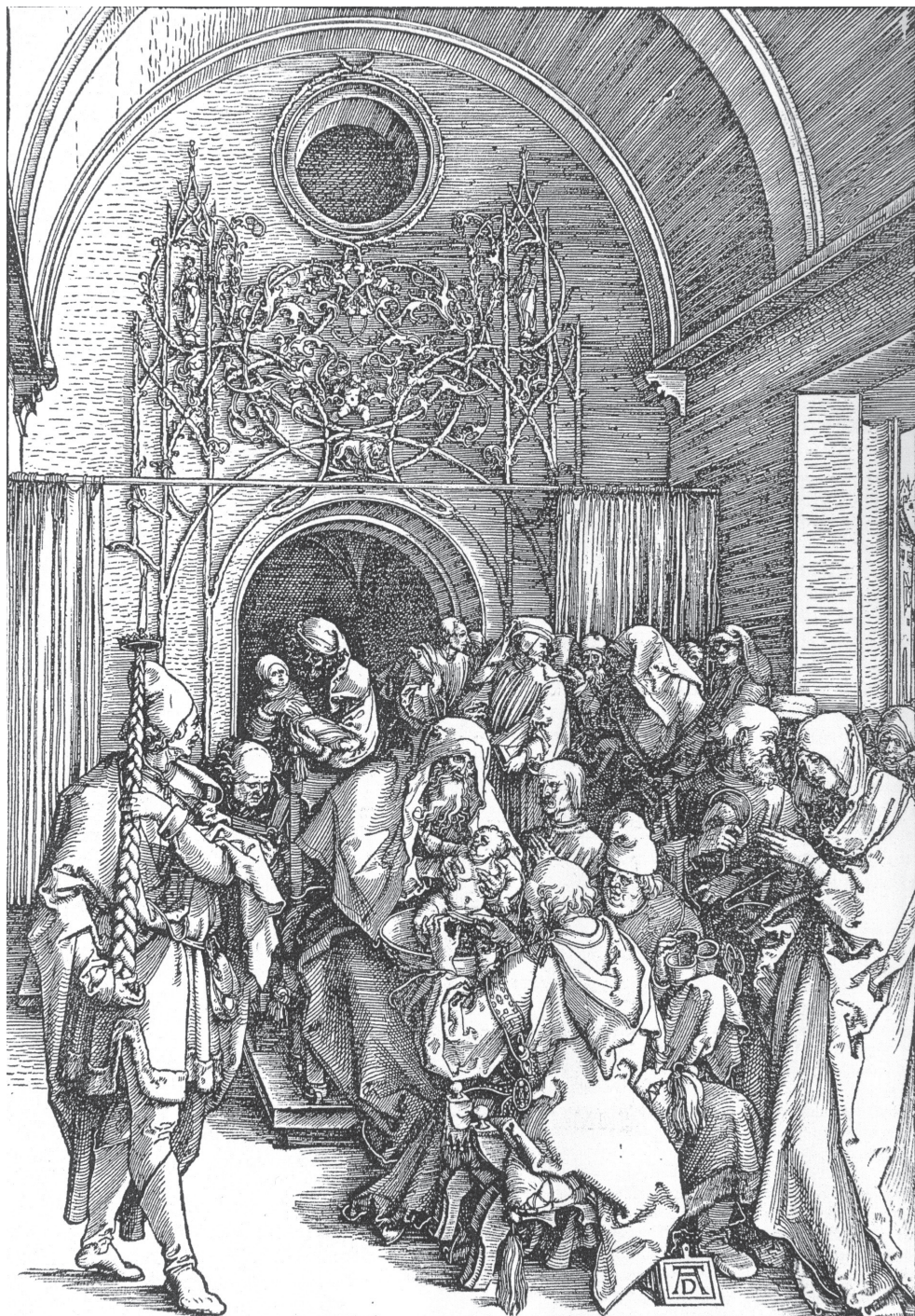
Fig. 3. Albrecht Dürer, Circoncisione , 1505, dalla serie Vita della Vergine