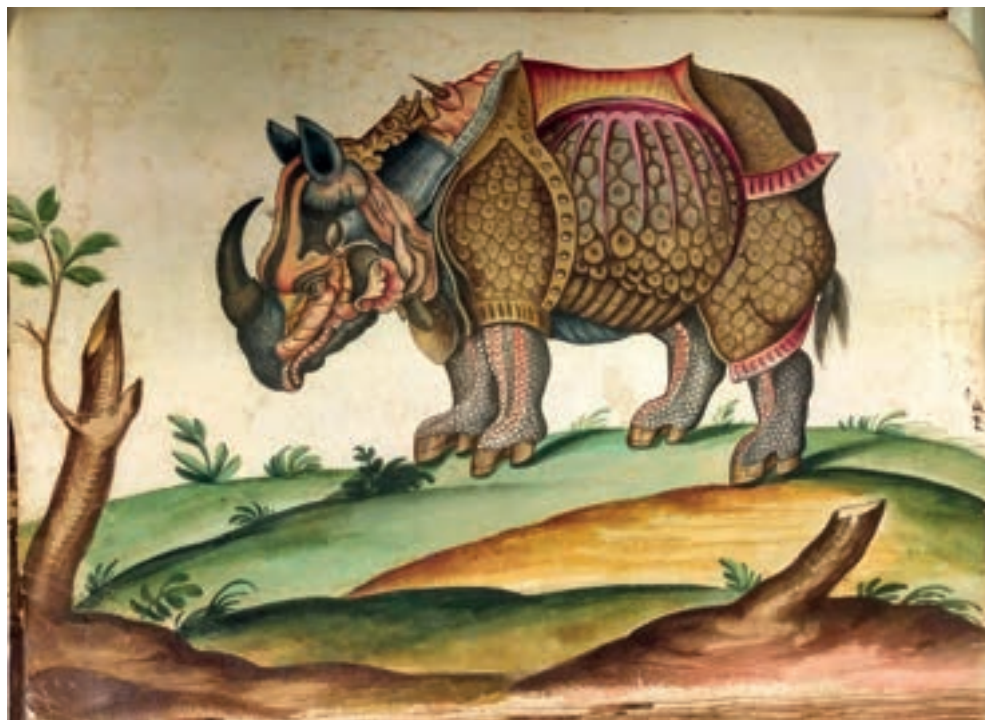
Fig. 5. Rinoceronte , Ms. 2, Roma, Biblioteca Universitaria Alessandrina