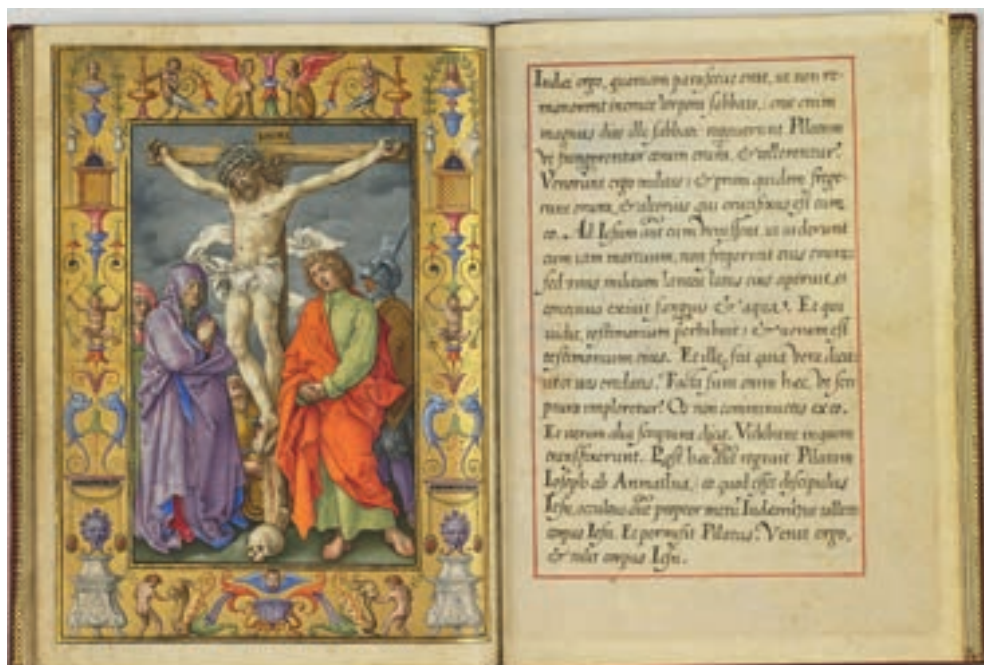
Fig. 1. Crocifissione di Cristo , Ms. 39, f. 12v, Chantilly, Musée Condé