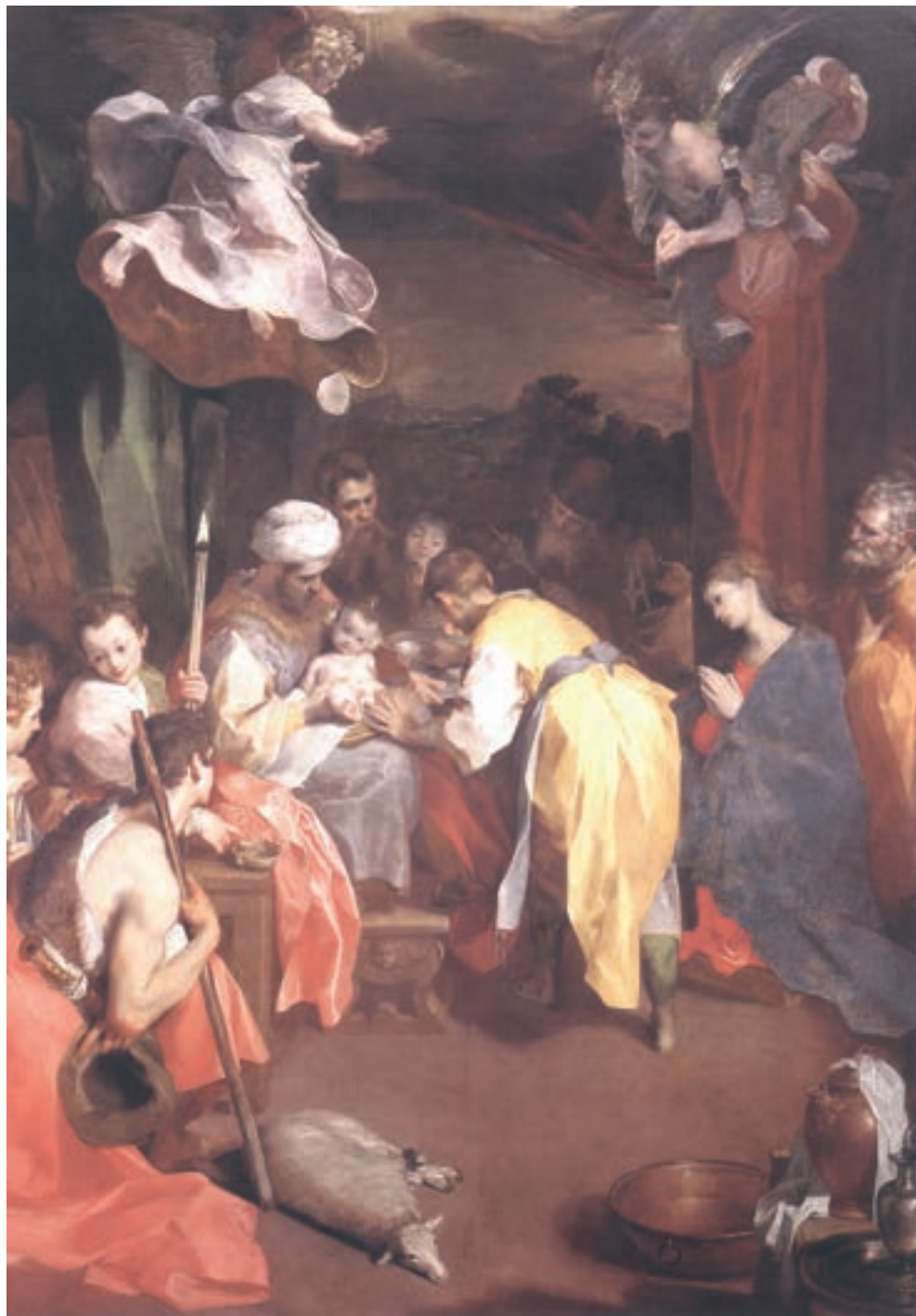
Fig. 4. Federico Barocci, Circoncisione , 1590, Parigi, Musée du Louvre