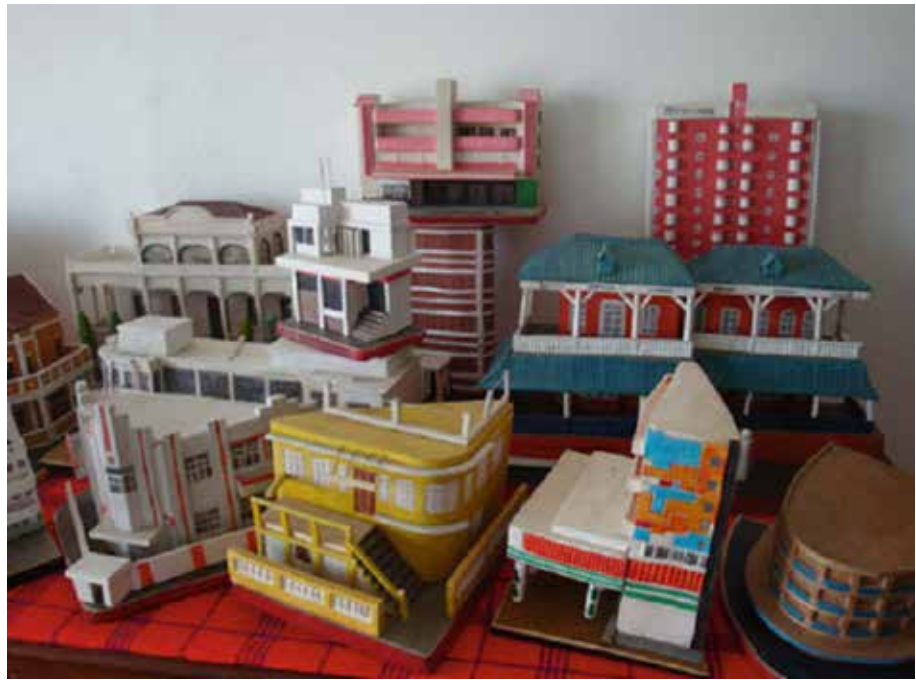
Fig. 3 “Maputopia”. Modelli di edifici coloniali di Maputo realizzati da artisti locali. Collezione AAMatters e Bernard Groosjohan (da Folkers).

“simbolo” come base di ogni cultura e come principio di una conoscenza fondata sulla “commozione” ( Ergriffenheit ) (Frobenius 1933).