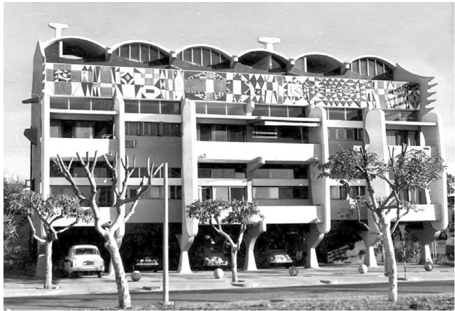
Fig. 4 Pancho Guedes, Residenze “Leão que Ri”, Maputo [Lourenço Marques], Mozambico, 1954-58 (da Kultermann 1969).