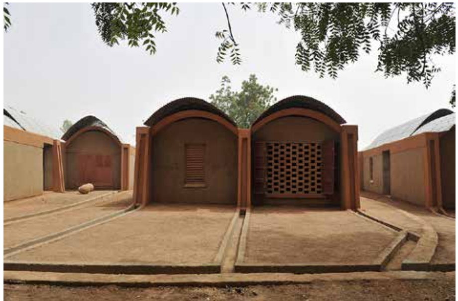
Fig. 10 Diébédo Francis Kéré, Alloggi per gli insegnanti a Gando, Burkina Faso, 2004.