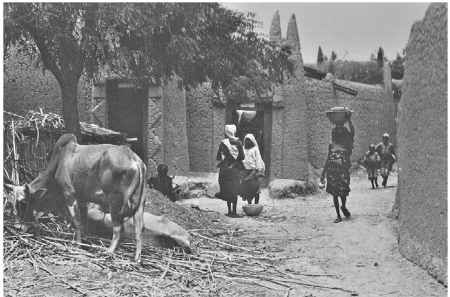
Fig. 2 Villaggio di Kano, Nigeria (da Oliver 1971).

tra parte, attraverso la “cultura della cooperazione”, si rischia di intervenire in questi contesti con un discutibile atteggiamento pietista, imponendo, seppur a fin di bene, modelli estranei alle culture locali. Fortunatamente la “cooperazione allo sviluppo”, se in passato ricorreva a scelte che non sempre rappresentavano un impulso per la crescita delle comunità, nelle esperienze recenti mostra un approccio maggiormente integrato con i territori, più attento alle identità, alle risorse naturali e ai sistemi produttivi locali.