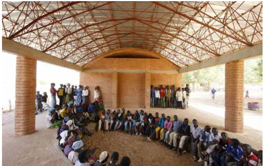
Fig. 6 Diébédó Francis Kéré, Estensione della Scuola primaria a Gando, Burkina Faso, 2006-08.

dividui; traggono forza dalla ritualità del ripetere atti antichi, ma che ogni volta si rinnovano, anche grazie agli scambi con le altre culture, tra cui quella occidentale.