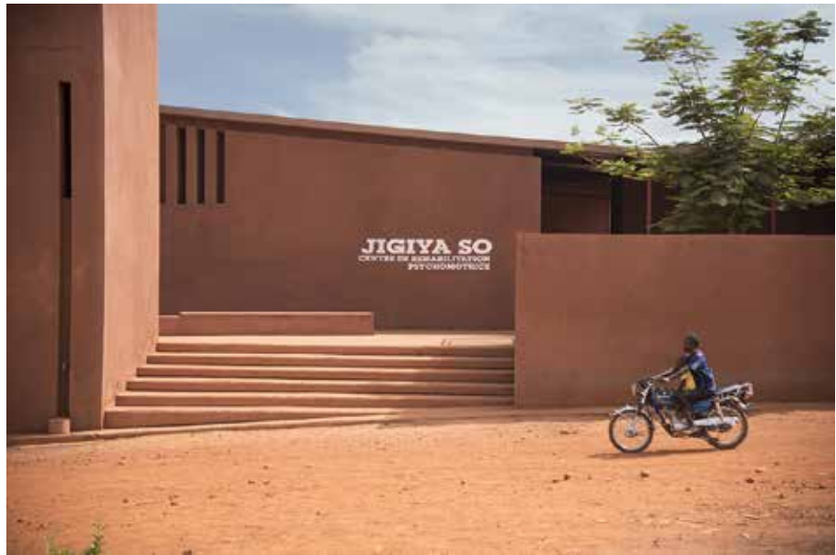
Fig. 13 caravatti_caravatti architetti, Centro di riabilitazione psicomotoria Jigiya So, Mali, 2005-14. © caravatti_caravatti architetti