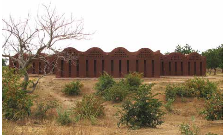
Fig. 14 caravatti_caravatti architetti, Scuola elementare a Kobà, Mali, 2006-07. © caravatti_caravatti architetti

primarie e una secondaria, una biblioteca e alloggi per docenti –, la Scuola secondaria a Dano, il Centro medico di Léo, l’Orfanotrofio di Noomdo, il Liceo Schorge di Koudougou, l’Opera Village di Laongo. E ancora, Kéré ha progettato in Mozambico un insediamento per la comunità residenziale di Benga Riverside e in Kenia lo Startup Lions Campus.