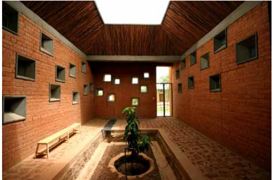
Fig. 9 Diébédo Francis Kéré, Cortile del Centro per la salute e l'assistenza sociale, Laongo, Burkina Faso, 2012-14. © Kéré Architecture