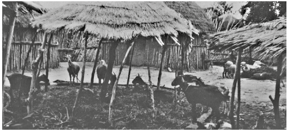
Fig. 1 Un villaggio Fulani, Nigeria (da Oliver 1971).