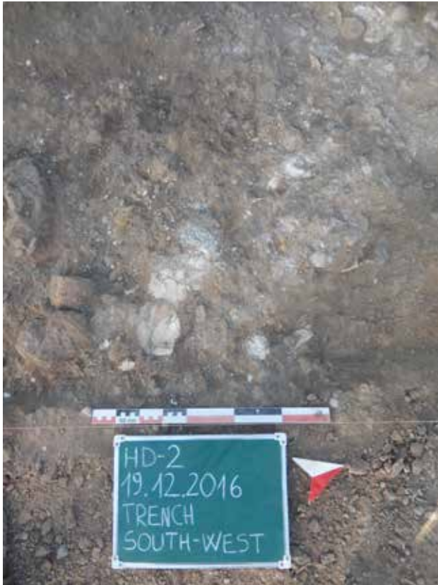
Particolare di un'area di lavorazione della Pinctada localizzata tra i resti delle strutture. Detailed view of Pinctada working area among the dwelling remains.

Nella pagina precedente/ in the previous page . Vista panoramica di una trincea di scavo e della laguna sullo sfondo. Panoramic view of a trench excavation and the lagoon in the background.