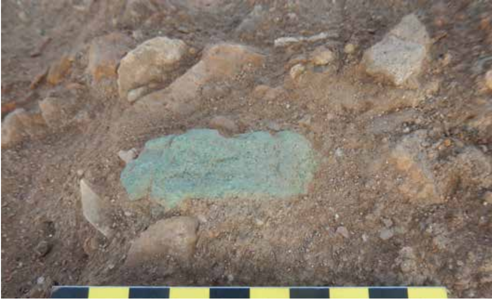
Particolare di un blocchetto di rame rinvenuto sui livelli superiori all'interno di una struttura. Detailed view of a small copper block recovered on the upper layers within the dwelling.

Located on a rocky headland and surrounded by the sea on three sides, the site of HD-2 (Ras al-Hadd - 2) is an archaeological area which was firstly recorded by the Joint Hadd Project in the 80s. Due to the imminent construction of new touristic structures, Ministry of Heritage and Culture of the Sultanate of Oman involved the Italian Archaeological team headed by Dr. Francesco Genchi and under the supervision of the late Prof. Maurizio Tosi for a rescue archaeology excavation. The site was heavily damaged by the several climatic and anthropic actions which destroyed, during the last forty-fifty years, most of the stratigraphy.