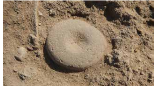
Un tipico strumento in pietra del neolitico, probabilmente utilizzato come incudine, ottenuto da un ciottolo di wadi. A typical neolithic stone tool, probably used as anvil, obtained from a wadi pebble.

La fase di occupazione individuata è caratterizzata dalla presenza di evidenze abbastanza comuni come tracce di focolari circolari e fosse, e da alcune strutture che potrebbero essere interpretate come paravento