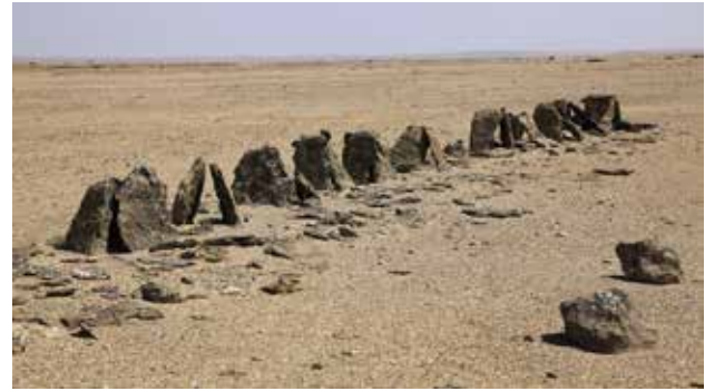
Un esempio di un trilite ben conservato identificato nelle piane terrazze. An example of a well preserved trilith identified in the plain terrace.

Questa analisi ha permesso la realizzazione di un definitivo e preciso censimento e di una sistematizzazione delle informazioni archeologiche al fine di rendere più agevole e accessibile il riconoscimento e la conseguente conservazione delle evidenze.