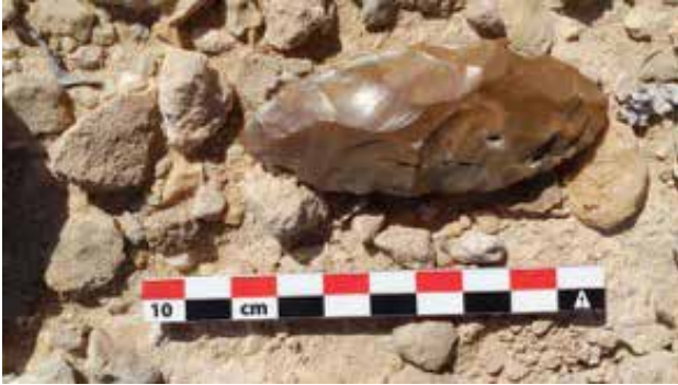
Una punta bifacciale recuperata nelle aree di dispersione litica. A lithic bifacial point recovered in the scattered lithic area.