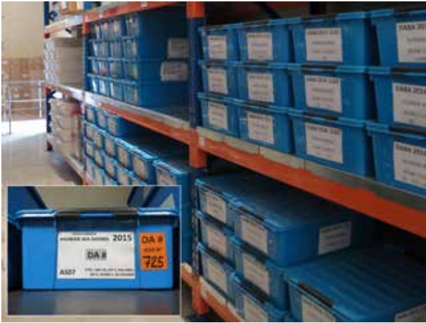
Contenitori di Campioni Archeologici immagazzinati nella struttura del Ministry of Heritage and Culture a Muscat ed esempio di contenitore per Reperti Rilevanti. Containers of Archaeological Samples stored in the complex of the Ministry of Heritage and Cultural in Muscat and an example of container for Relevant Finds.