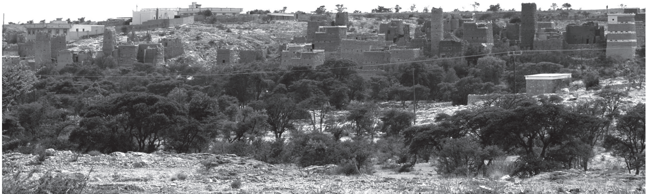
Fig. 2 - La città storica di Al-Jahamah che si fonde con il paesaggio naturale in pendenza. Historical town of Al-Jahamah's townscape blending into the sloping natural landscape.

Questo fenomeno si osserva nell'insediamento di Al-Jahamah , dove si trovano torri difensive rotonde in luoghi strategici (di solito vicino ai campi agricoli) e corsi d'acqua naturali che si intersecano con il wadi , permettendo l'irrigazione delle terrazze agricole (Klingmann, 2022). Inoltre, il suolo leggermente inclinato ha permesso la costruzione degli edifici storici su un terreno elevato (fig. 4). In questo modo, gli abitanti potevano affacciarsi sui propri campi coltivati anche quando si trovavano nelle loro case.