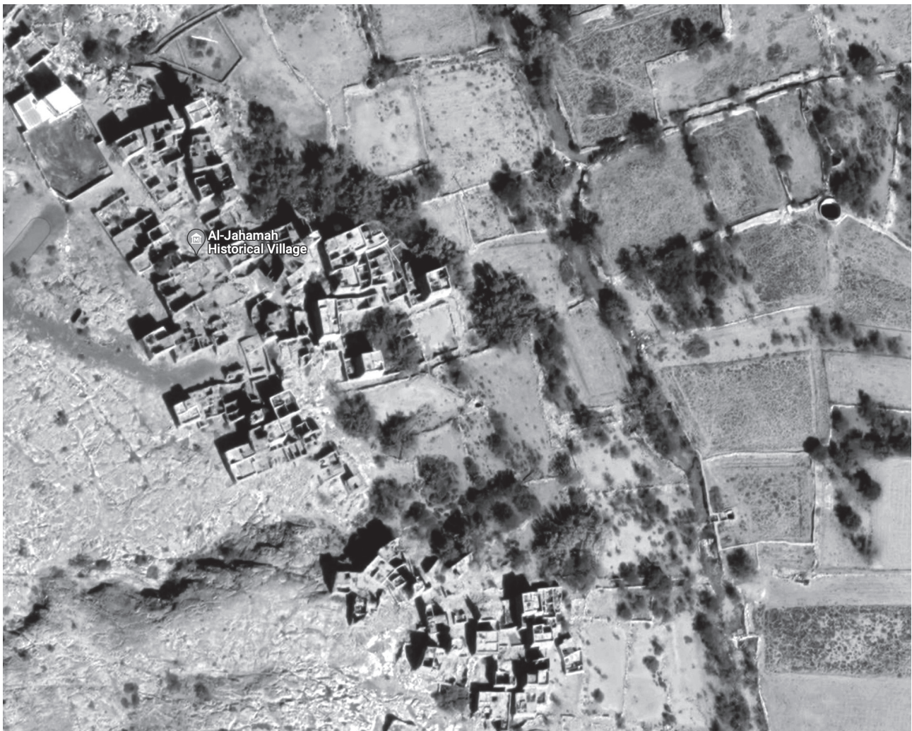
Fig. 3 - L'insediamento storico di Al-Jahamah e gerarchia dei percorsi con i terreni agricoli. Google Earth.

Historical settlement of Al-Jahamah and hierarchy of the different paths with the agricultural lands. Google Earth.