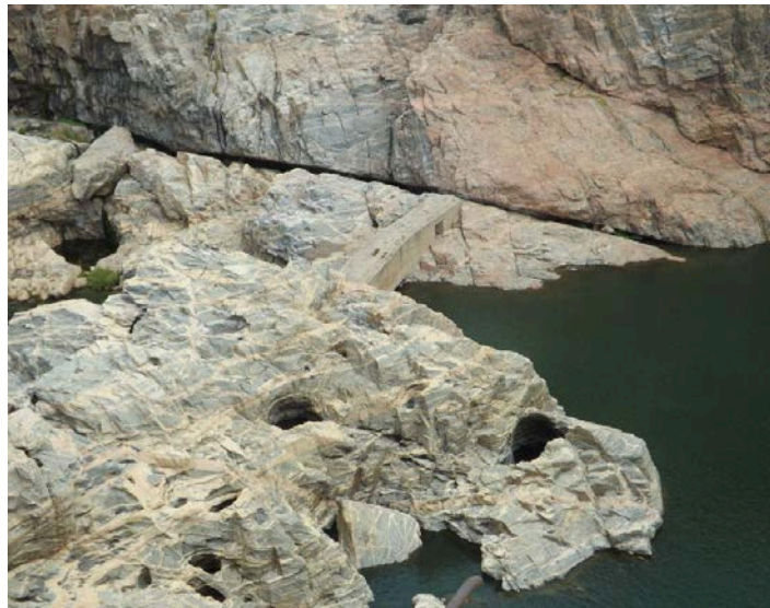
Figura 10: Mini ponte de alvenaria utilizada por S. flavius chegarem ao Estado da Bahia. Abril de 2013.

prego-galego na margem esquerda do cânion, estado de Alagoas, já foi relatado por Batista (2008) em estudos sobre densidade e tamanho populacional do gênero Sapajus (anteriormente classificado como Cebus ). Porém, a literatura primatológica da época, não mencionava a espécie Sapajus flavius na área, vindo este autor a tratá-los como Cebus libidinosus , e sua ocorrência se restringiu ao referido Estado. Em 2012, a ocorrência dos macacos-pregos-galego na cidade de Paulo Afonso, Bahia, foi confirmada no bairro Vila Nobre por Silva (2014) durante aquela investigação foi a presença dos macacos-pregos-galegos no bairro Vila Nobre e a migração natural dos animais, através das pontes artificiais (Figura 8) construídas pela Companhia Hidrelétrica do São Francisco (CHESF) (BATISTA, em prep.; SILVA, 2014).