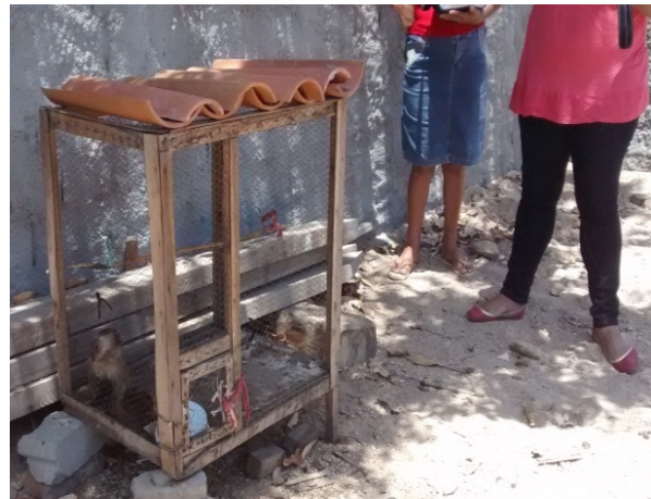
Figura 9: Infante de Sapajus flavius cativo.

O total dos entrevistados (N=21) afirmou conhecer os animais amostrados nas pranchas (P1), porém a presença desses primatas sempre foi relatada na margem esquerda do cânion, no estado da Alagoas. Esse conhecimento foi corroborado por relatos de pescadores, quando era comum visualizarem (P2) e ouvirem os macacos-prego vocalizarem na margem esquerda do cânion no estado de Alagoas. Segundo os moradores em conversas informais, o grupo varia entre 20 e 80 animais. Perguntados sobre a composição da dieta desses macacos nas caatingas do cânion (P11), 100% dos entrevistados afirmaram: “Os macacos comem de tudo”, unanimemente completaram: “Macaco é um bicho que come de tudo, mas nesse mato aí, não tem muito que eles comerem não, o alimento está pouco”. Quando perguntados sobre o que eles sabiam sobre os macacos, 100% dos moradores responderam que já os “conheciam de filmes, zoológicos e que os mesmos são muito inteligentes, agitados e ladrões” (P3). Em conversas informais, constatamos que os animais já chegaram muito perto dos humanos, vindo inclusive pegar comida das suas mãos.