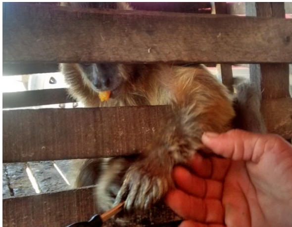
Figura 8: Sapajus flavius adulto, cativo há mais de 20 anos.

Através de conversas informais com moradores do bairro Vila Nobre, descobrimos que os macacos-prego estão sob pressão antrópica como caça, tráfico, apanha (captura), choques nas redes de alta tensão, caça com cachorros, bem como cativeiro ilegal (Figuras 6 e 7), fato este que não ocorre no bairro.