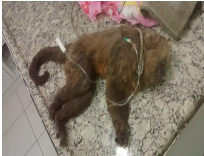
Figura 11: S. flavius apresentando sinais de envenenamento.

Nenhum morador relatou a ocorrência de agressões (mordida, arranhões) (P15) por parte dos macacos. Apesar da utilização de (P8) paus e pedras pelos macacos, nestes casos o conflito se restringiu a meras ameaças. 15 (71%) entrevistados, afirmaram ter conhecimento de que, alguns moradores estão maltratando os animais, utilizando métodos agressivos de contenção. Neste estudo, os métodos (P9) relatados pelos moradores foram “pedras”, “pequenas bombas”, “água” e “veneno” (Figura 11). Este último foi constatado pela equipe do corpo de bombeiros.