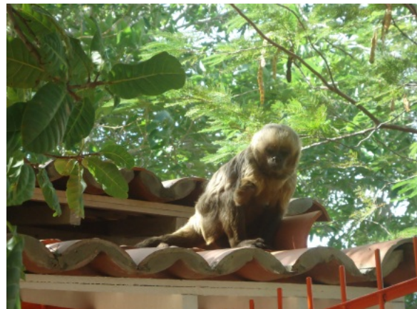
Figuras 6 e 7: representantes de macaco-prego-galego, gênero Sapajus (Schreber, 1774). Fonte: Wallace Pinto Batista, abril de 2013