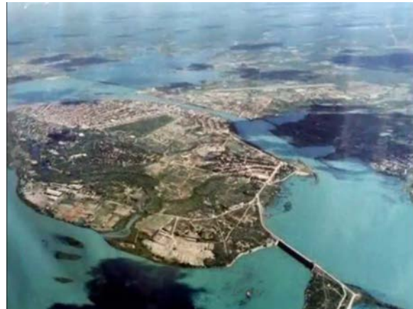
Figura 3: Ilha Artificial de Paulo Afonso.