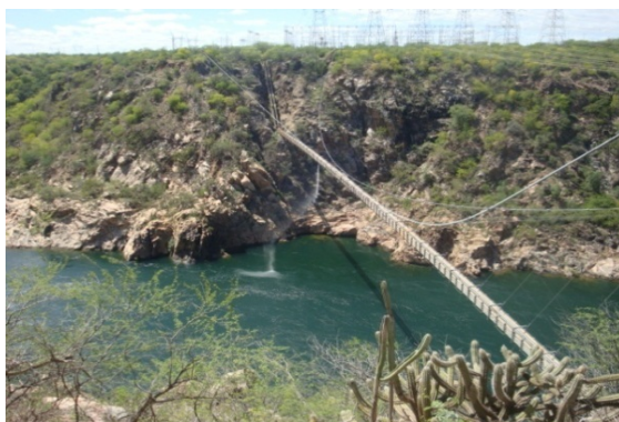
Figura 4: A Ponte pênsil PHB. Abril de 2015.