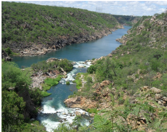
Figura 2: Cânion do rio São Francisco na cidade de Paulo Afonso - Bahia.