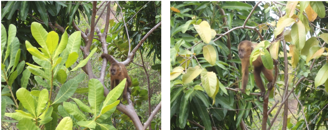
Figura 10 e 12. Presença de S. flavius forrageando nos pomares no bairro Vila Nobre.

Dito pelos moradores em conversas informais: “ Os macacos adoram a manga, sendo a época de floração desta fruta, a ideal para se avistarem grandes grupos de macacos, e a frequência deles nessa época é constante ”. Sprague (2002) diz que macacos, aproveitando-se de alimentos de fontes antrópicas, são um velho problema para a sociedade há décadas. Os mesmos, utilizando-se de seu carisma, interagem com as pessoas, chegando a se alimentar diretamente da mão dos humanos. Engeman et al. (2010), estudando os conflitos com Macaca mulata em Porto Rico, afirmam que ao se estabelecer uma “relação comensal” entre os humanos e os macacos, os “danos intensificam-se pois os animais passam a associar humanos com comida”. Estudos no Brasil, no Parque Nacional de Brasília, apontam que a proximidade com humanos fez com que macacos deixassem de procurar alimento na natureza, tendo maior interesse pelos alimentos trazidos pelos visitantes do parque (SABBATINI et al. , 2008). Essa informação embasa os dados obtidos neste estudo onde, o grupo de S. flavius , costuma visitar locais específicos do bairro em busca de comida.