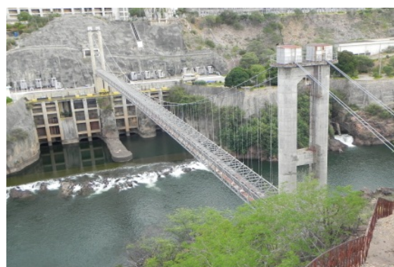
Figura 5: Ponte pênsil usinas PA I, II e III. Abril de 2015.