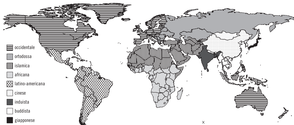
Fig. 1 – Lo scontro di civiltà secondo Huntington