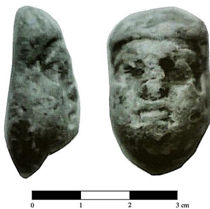
Fig. 4 - Peso in piombo configurato a testa di sileno da Amrit (da Elayi - Elayi 1997, tav. XXXVI).