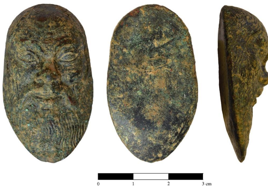
Fig. 1 - Testa di sileno in bronzo MAC.15.500.