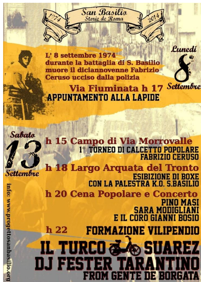
Fig. 3. Manifesto del progetto San Basilio, storie de Roma , maggio 2014.

A seguito degli incontri, l'8 settembre del 2014, in occasione del quarantennale dalla morte di Fabrizio Ceruso, si svolgono le iniziative di commemorazione: