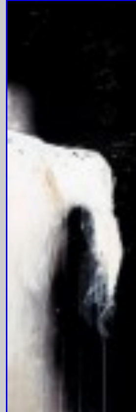
Fig. 4 NICCOLO' TRAMONTANA, Senza titolo , 2008 tecnica mista su tavola, cm. 35 x 80

Continua a esporre i suoi lavori a Bologna al LAB 16 e a Foligno (PG) presso il centro