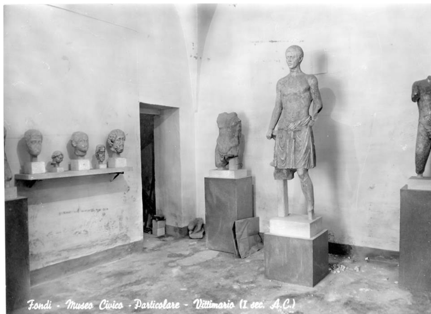
Fig. 3 Aula interna al Convento di San Francesco, Antiquarium allestito da Domenico Faccenna (da Quilici-Quilici Gigli 2007)

Alla raccolta epigrafica già curata dal Sotis, e al pari del resto del materiale archeologico non estraneo a furti e dispersioni, si aggiunsero altre iscrizioni di recente rinvenimento 17 .