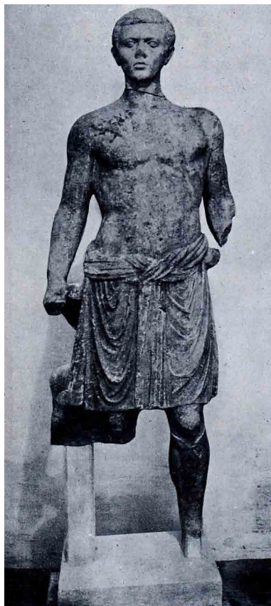
Fig. 7 Statua di Iuperco da via dei Volsci (da Faccenna 1954).

parsa, che si dice rinvenuta nel 1938 nelle fondazioni di un fabbricato in via Tito Livio 64 .