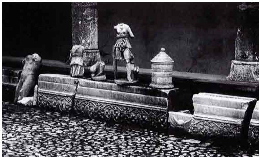
Fig. 2 Chiostro del Convento di San Francesco con il materiale archeologico allestito da Domenico Faccenna (da Quilici-Quilici Gigli 2007)

I reperti furono esposti nel chiostro di San Francesco e nei locali adiacenti, appositamente restaurati e riqualificati: si ha notizia della presenza di sculture integre, frammenti scultorei, teste marmoree, urne, puteali, basi, are, sarcofagi, cornici, capitelli, colonne, cippi e iscrizioni 12 (fig. 2).