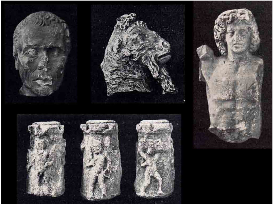
Fig. 4 Rinvenimenti effettuati da Domenico Mustilli nel centro storico (da Mustilli 1937).

dano, i quali, seppur per breve tempo 46 , incrementarono il patrimonio di antichità cittadine. Nel 1936 i considerevoli lavori di scavo delle trincee necessarie alla realizzazione della rete fognaria di servizio alla città 47 , operazioni che coinvolsero l'intero comparto del centro storico, furono all'origine delle scoperte effettuate dall'Ispettore ai Monumenti, gallerie e scavi di antichità della Regia Soprintendenza di Napoli Domenico Mustilli 48 .