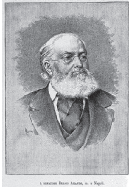
Fig. 1 Senatore Enrico Amante

Della raccolta, allestita in un'ala del convento di San Domenico e resa fruibile al pubblico, oltre a diverse iscrizioni facevano parte «sette teste, una stupenda statua seduta acefala, sette torsi, un mulino a mano, una statua di Diana, mosaici, marmi policromi, colonne, capitelli, cornicioni, bassorilievi, anfore, stemmi, dolii, una mano antichissima di terracotta, tubi di piombo, cippi calcarei, una cassa di piombo» 9 . Ignoti restano il sito e il contesto di provenienza di questo materiale antico, venuto alla luce nel corso di scavi occasionali o grazie a rinvenimenti fortuiti, talvolta effettuati dal Sotis in persona, che interessarono sia il centro urbano sia alcune aree immediatamente extraurbane.