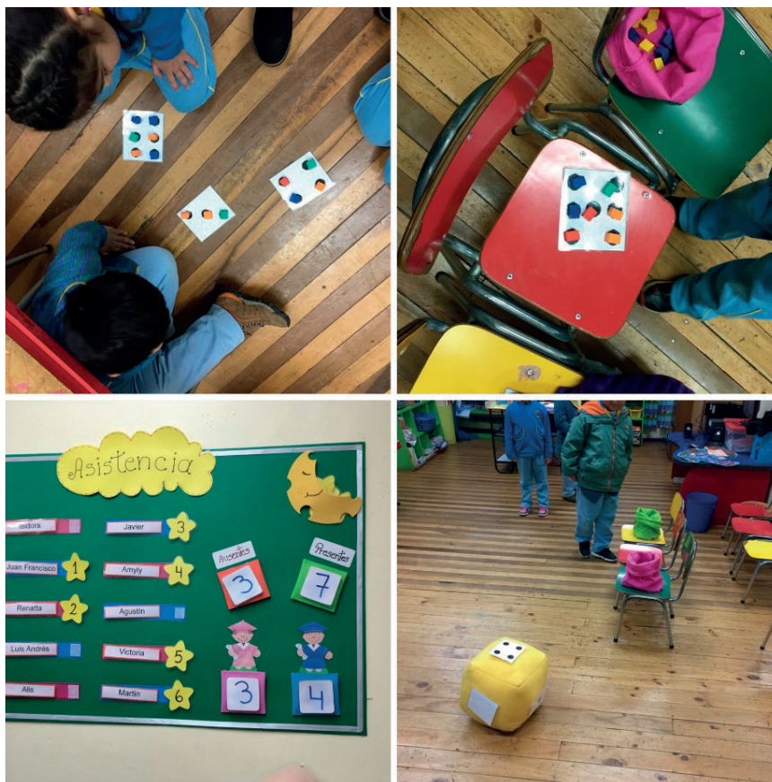
Figura 2. – Parte del registro de actividades de implementación sugeridas o diseñadas en el Taller de iniciación ABN con los profesores participantes.

Durante las sesiones del taller, se fueron trabajando las etapas propias de la secuenciación de actividades en los distintos niveles, ilustrando así con detalle la progresión y consistencia de cada actividad con la siguiente en cuanto a su sentido y articulación. Además, durante el transcurso del taller, se fue solicitando a los participantes, que llevaran una bitácora con fotografías y videos de las actividades que estaban implementando, algunas de las cuales se presentan en la Figura 2 .